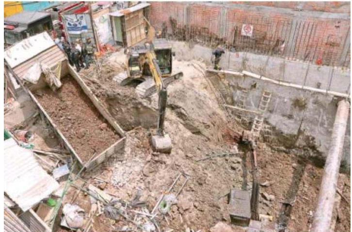
Denuncian vecinos inconformes que el uso de suelo de dicha obra es ilegal