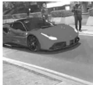
Participaban autos de alta gama

Las carreras clandestinas eran en avenida Zacatépetl, Periférico sur y calle Las Praderas