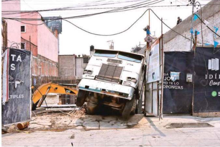
El desgajamiento de tierra en una construcción provocó que el torton se hundiera y dejara al menos tres trabajadores lesionados