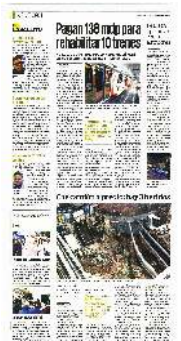
El camión de 10 toneladas cayó a un predio en la colonia Valle Gómez, en la alcaldía Cuauhtémoc.