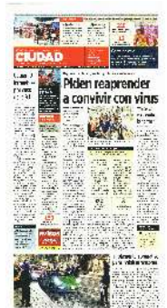
Los vehículos se reunían en Avenida Zacatépétl y Calle Las Praderas, precisamente donde se implementó un punto de revisión