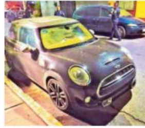
Paramédicos del Escuadrón de Rescate y Urgencias Médicas realizaron la denuncia