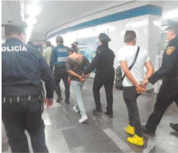
En tres meses 115 personas han sido detenidas