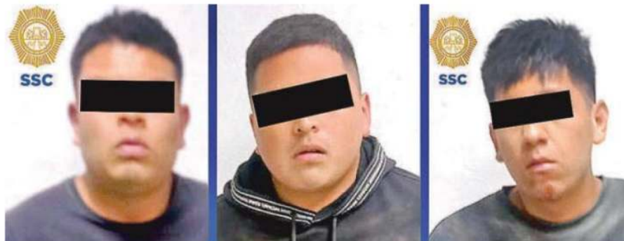
Los hombres, de 21, 22 y 23 años de edad fueron puestos a disposición del MP

Ante tales hechos, los tres hombres, de 21, 22 y 23 años de edad fueron detenidos y puestos a disposición del agente del MP, quien determinará su situación legal.