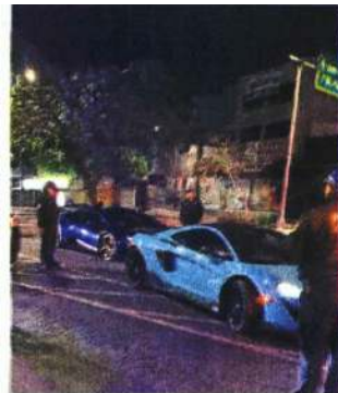
En los arrancones participaban automóviles de alta gama.

“En este gobierno estamos comprometidos a preservar la seguridad. Con esta acción atendemos las denuncias que se habían presentado en días recientes por parte de vecinas y vecinos de la zona, quienes habían señalado que estas prácticas de carreras se realizaban recurrentemente en la madrugada”, indicó el alcalde Giovanni Gutiérrez. ●