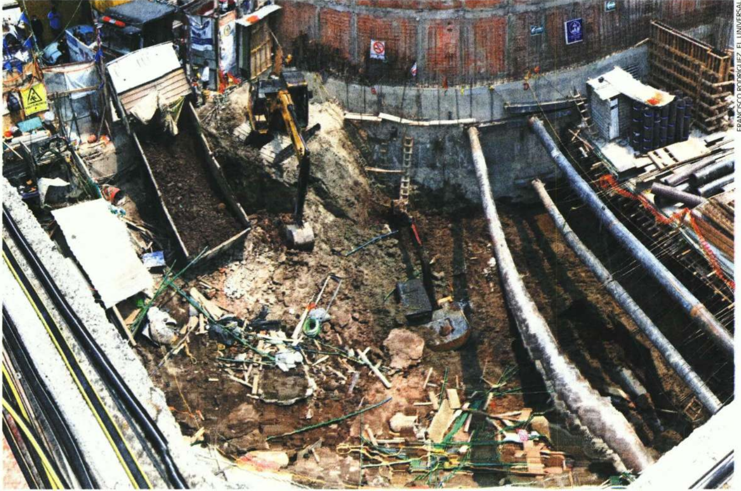
FRANCISCO RODRIGUEZ, EL UNIVERSAL