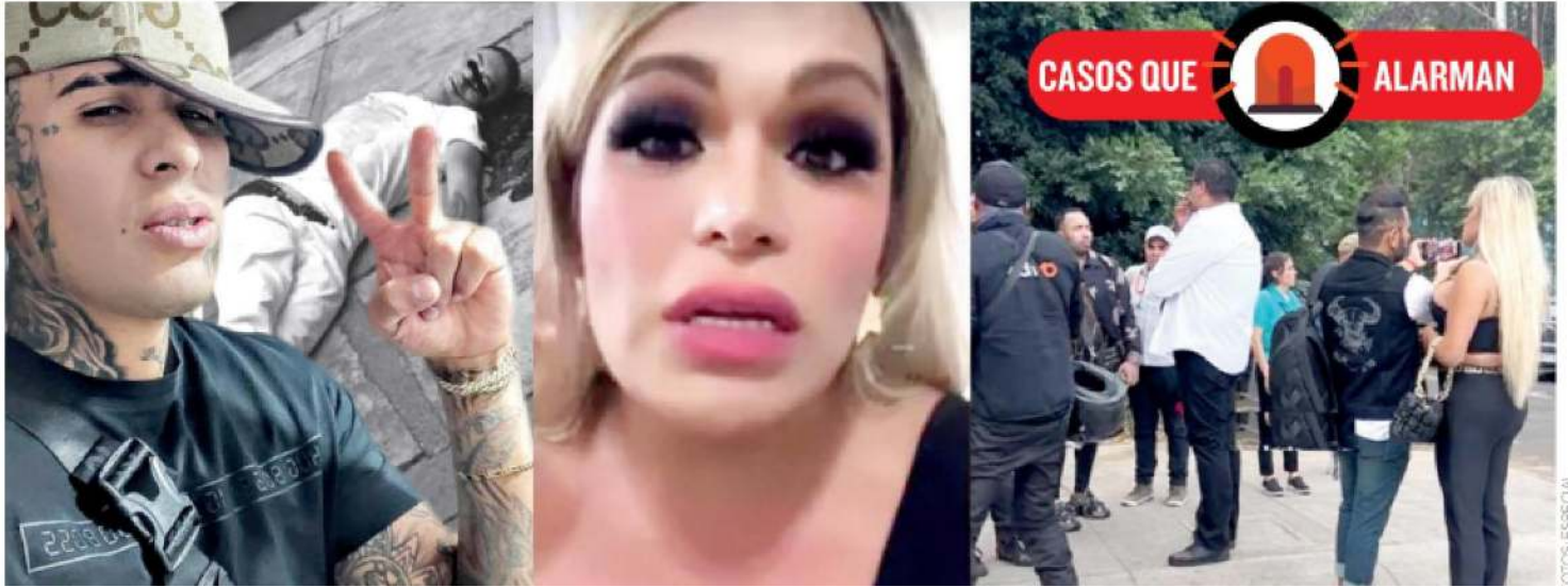
-La Fiscalía General de Justicia capitalina continúa con las indagatorias