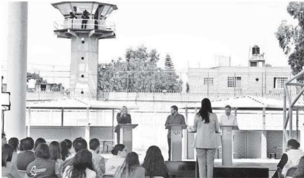
Así se realizó el primer debate al interior de un reclusorio entre los líderes de los partidos capitalinos