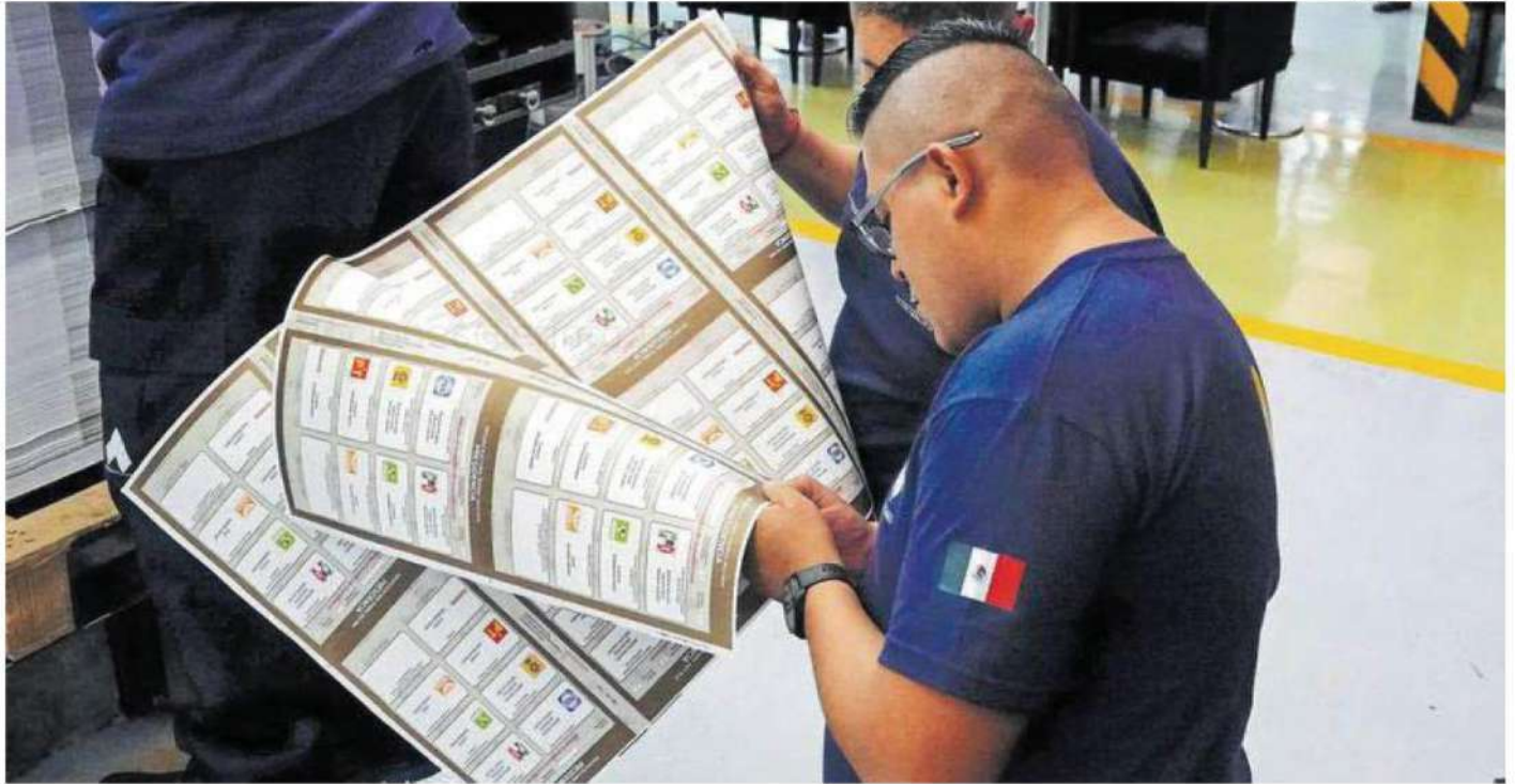
Se han impreso 317 millones de boletas y documentación para distribuir en todo el país.