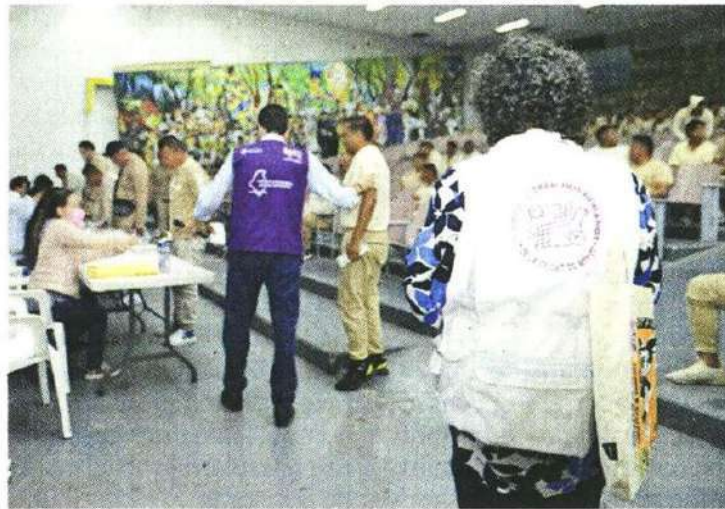
Personal de CDH estuvo presente en el registro de solicitudes de internos para participar en la jornada electoral.

Así como mil 876 votos para la coalición Morena-PT-PVEM, la cual resultó ganadora en la elección a Gubernatura.