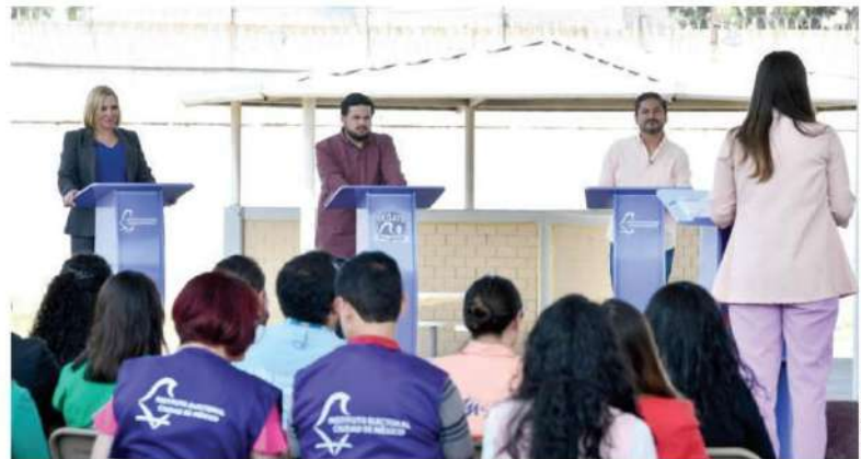
REPRESENTANTES de aspirantes a la Jefatura de Gobierno en el debate del 3 de mayo.

862 personas privadas de la libertad sufragarán