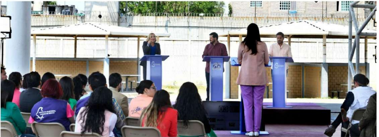
Representantes de las distintas fuerzas políticas que van por la jefatura de Gobierno de la Ciudad de México, durante el debate en Santa Martha.