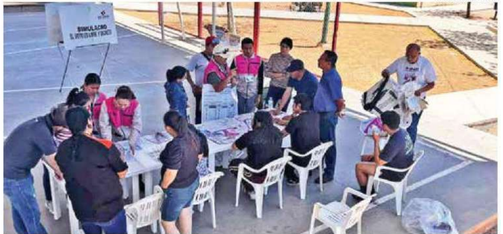
ALISTAN | • Funcionarios del INE tuvieron el primer ensayo del PREP.