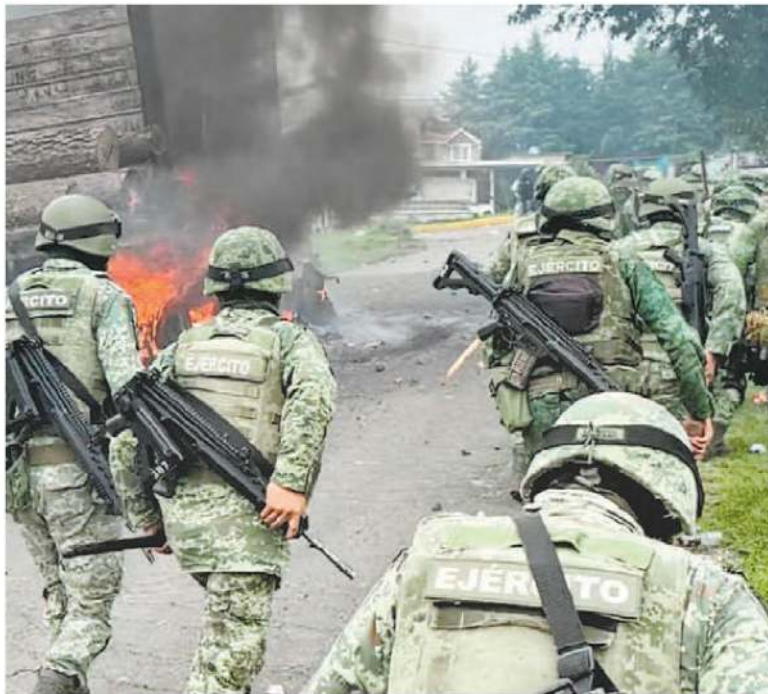
Operativo contra talamontes en Morelos, el 2 de agosto