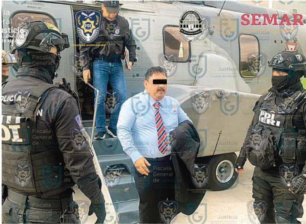
Las instituciones deben estar del lado de las víctimas, dicen morenistas sobre la detención de Uriel "N"