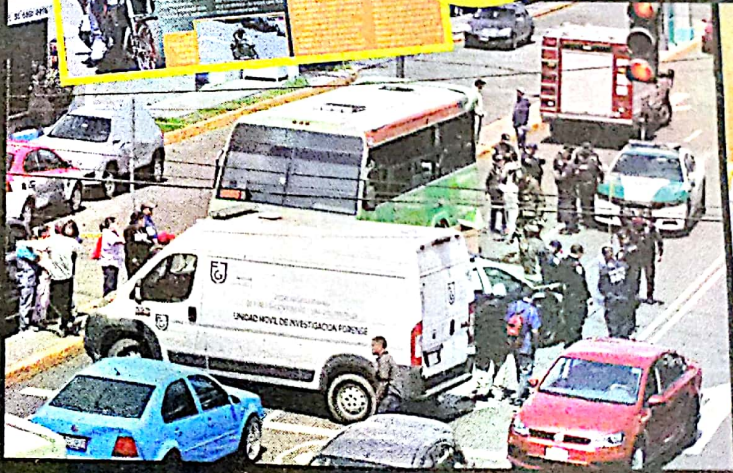
El chofer del camión colectivo de la Ruta 15 fue detenido.

MAYO 23 Motoristas denunciaron un retén donde polis les exigían “mordida”, en el mismo punto.