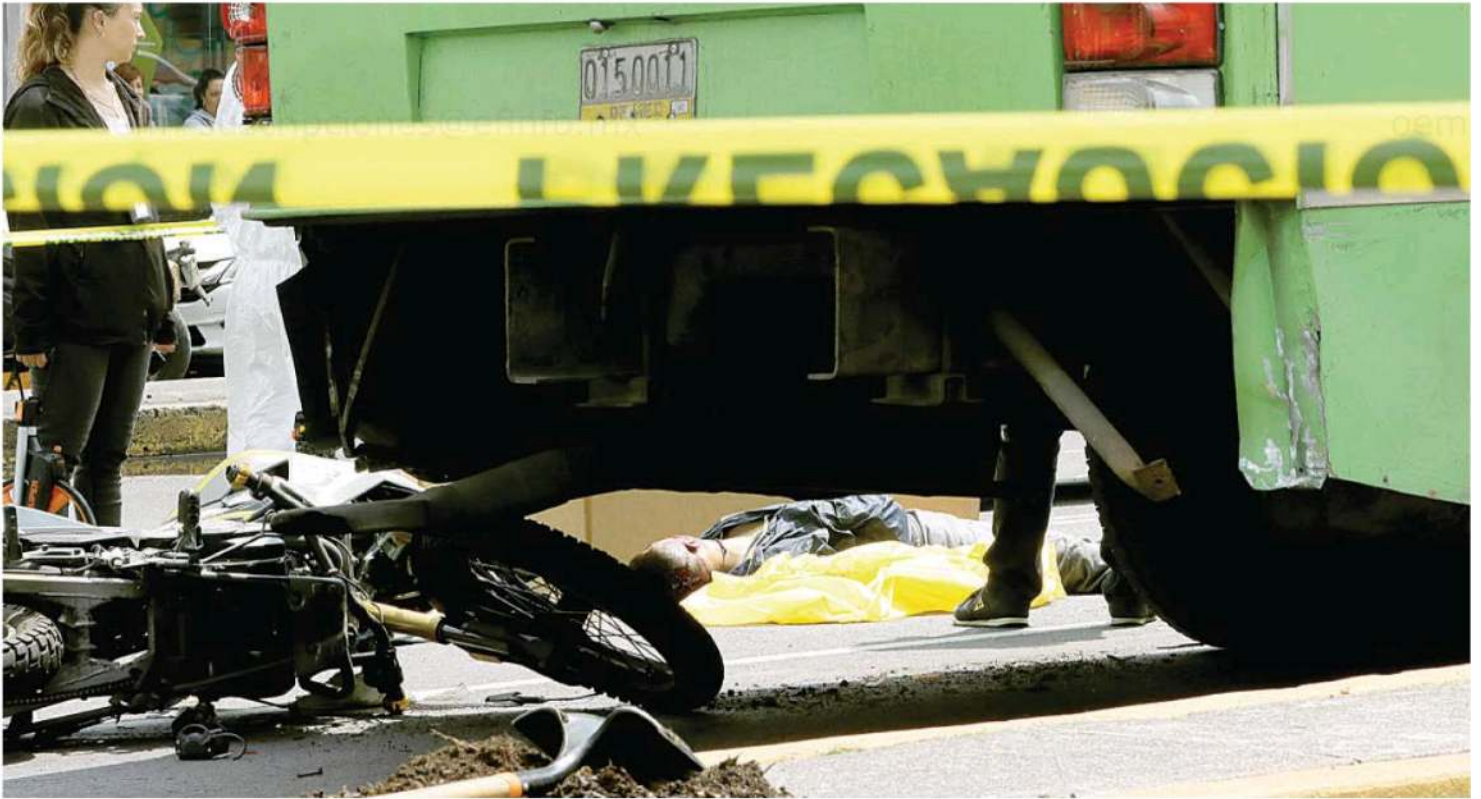
Motociclista muere tras impactarse contra camión de transporte público, en la colonia Colina del Sur