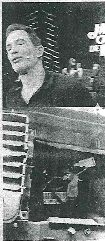
Perdió miles de pesos

El actor hizo un llamado para que se acaben los asaltos en la ciudad