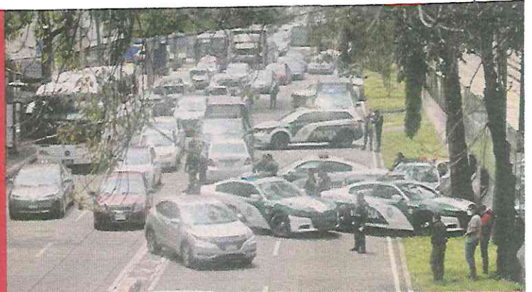
■ El percance provocó que la vialidad registrara tránsito lento.

“Refieren que fue un vehículo de transporte público, pero desconocemos si fue un camión