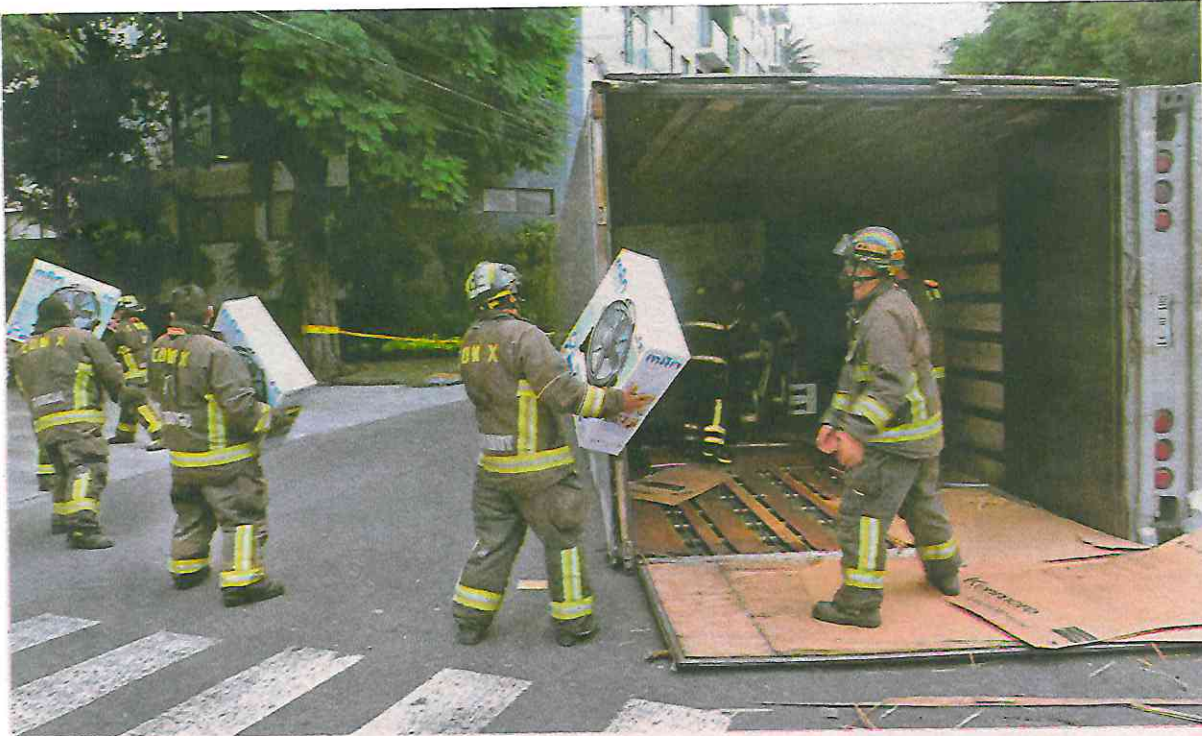
Fue necesario descargar los productos de la caja y utilizar grúas para poder enderezar el tráiler