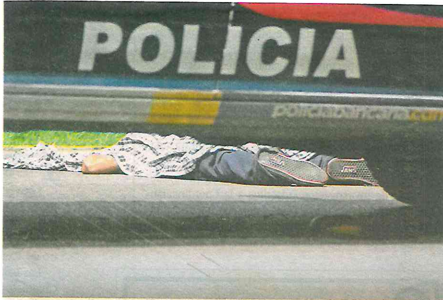
El fatal accidente ocurrió en calles de la colonia Campestre Churubusco, alcaldía Coyoacán / JOSÉ MELTON

Este policía de la SSC insultó y agredió a los representantes de los medios de comunicación en los momentos en que realizaban su labor periodística / JOSÉ MELTON