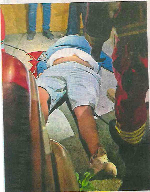
Una tercera víctima fue llevada en estado crítico a un hospital cercano y murió momentos después

Al llegar al lugar, los oficiales observaron a cuatro personas tiradas sobre la cin-