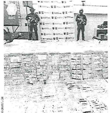
CATEOS. El fin de semana, se aseguraron más de cinco mil juegos de placas de autos y motos.