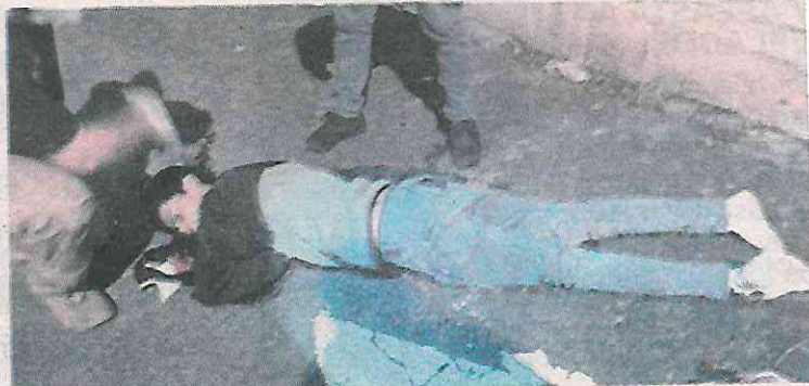
Tres de los jóvenes quedaron muertos en el lugar de los hechos

Un ataque similar ocurrió en la alcaldía Tláhuac, donde otras tres personas murieron por disputas entre narcomenudistas.