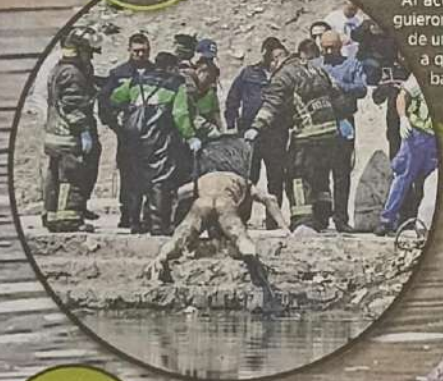
Rescatistas entraron a la laguna en una lancha.

El cadáver salió a flote en el cuerpo de agua.