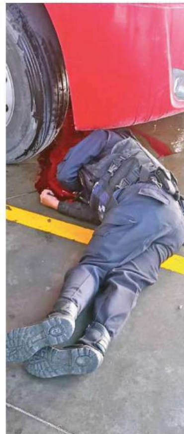
Los dos uniformados quedaron lesionados dentro de la gasolinera

Los custodios en cumplimiento de su deber bajaron de la unidad y se enfrentaron a tiros con los para evitar el asalto