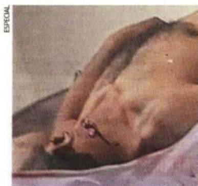
La víctima no fue identificada por los vecinos de la colonia Miguel Hidalgo.