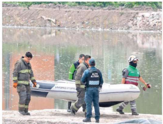
Dieron a conocer que con frecuencia los equipos de emergencia son requeridos en la zona pues personas que caminan por la orilla caen al agua y tienen que ser rescatados