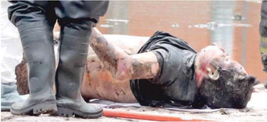
Nadie pudo identificar al fallecido aun cuando no presentaba heridas de violencia pues ya se encontraba hinchado y con rigidez cadavérica