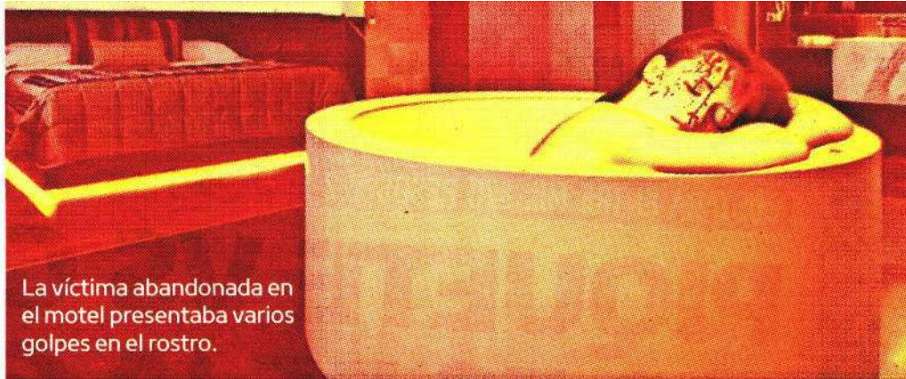
La víctima abandonada en el motel presentaba varios golpes en el rostro.