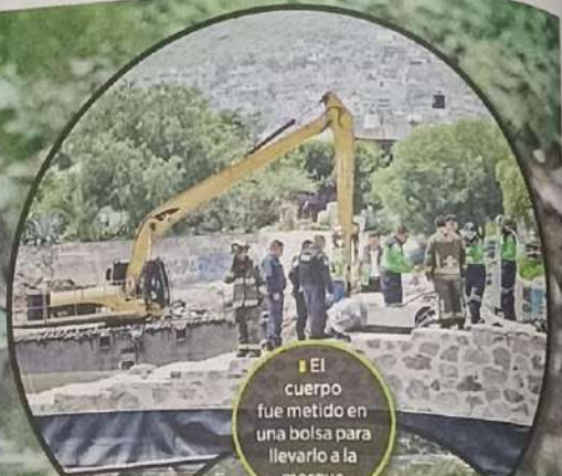
El cuerpo fue metido en una bolsa para llevarlo a la morgue.

Entre las personas que se reunieron en la orilla para observar las maniobras forenses, había dos jóvenes que evocaron su niñez, cuando la laguna se abarrotaba de patos y garzas.