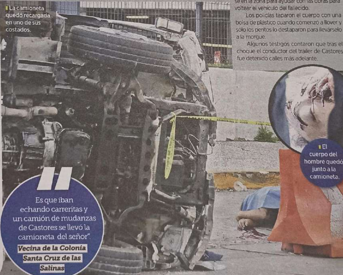
El cuerpo del hombre quedó junto a la camioneta.

Es que iban echando carreritas y un camión de mudanzas de Castores se llevó la camioneta del señor."