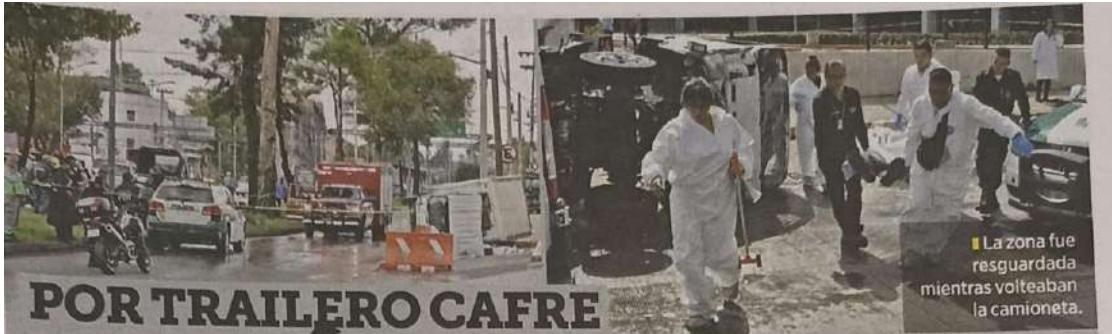
La zona fue resguardada mientras volteaban la camioneta.