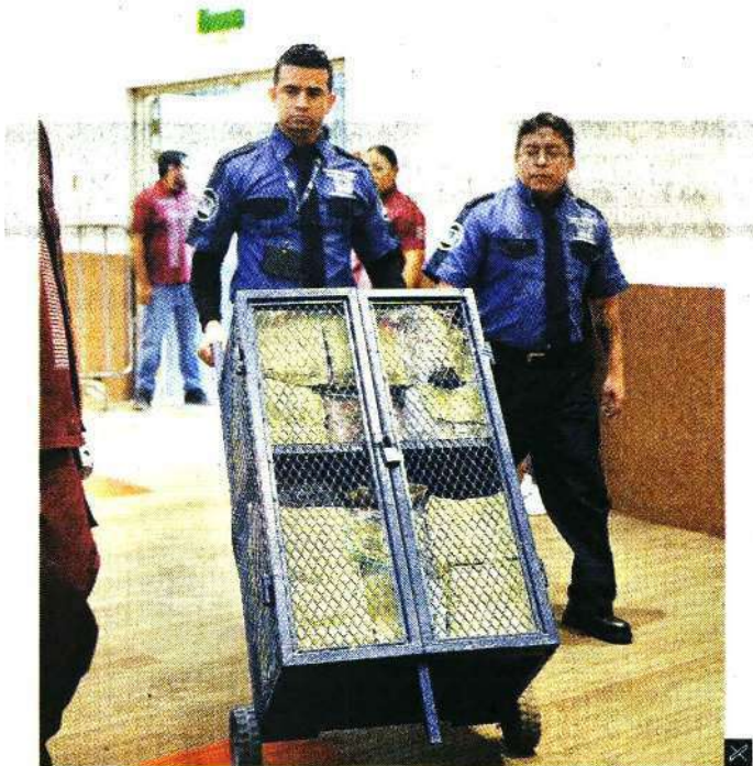
Personal de seguridad resguardó el manejo de boletas del proceso interno.