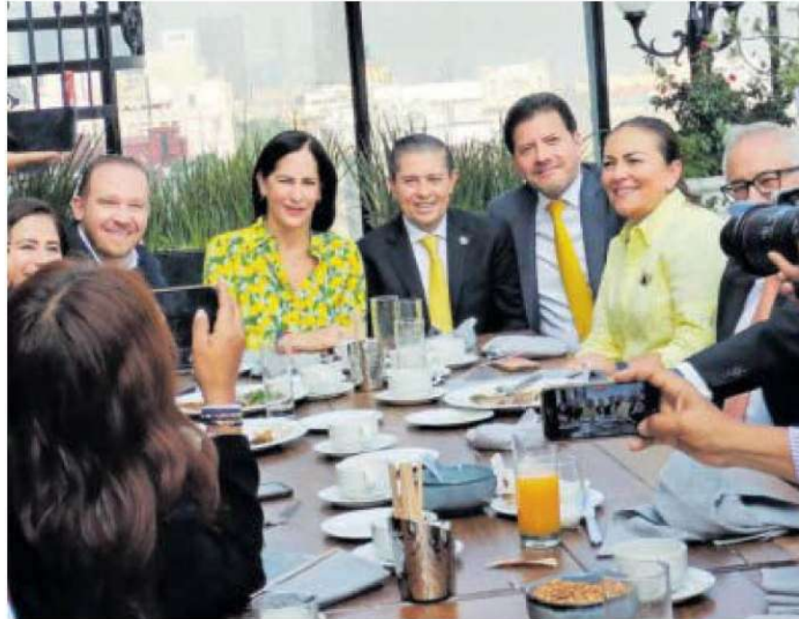
Lía Limón participó en la plenaria del PRD