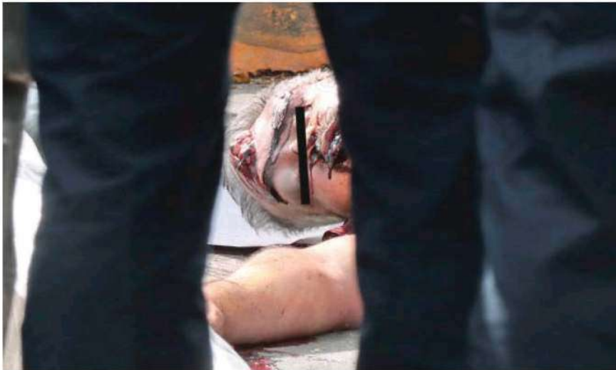
La cabeza de la víctima se impactó y se rompió al chocar contra el pavimento, por lo que murió al instante