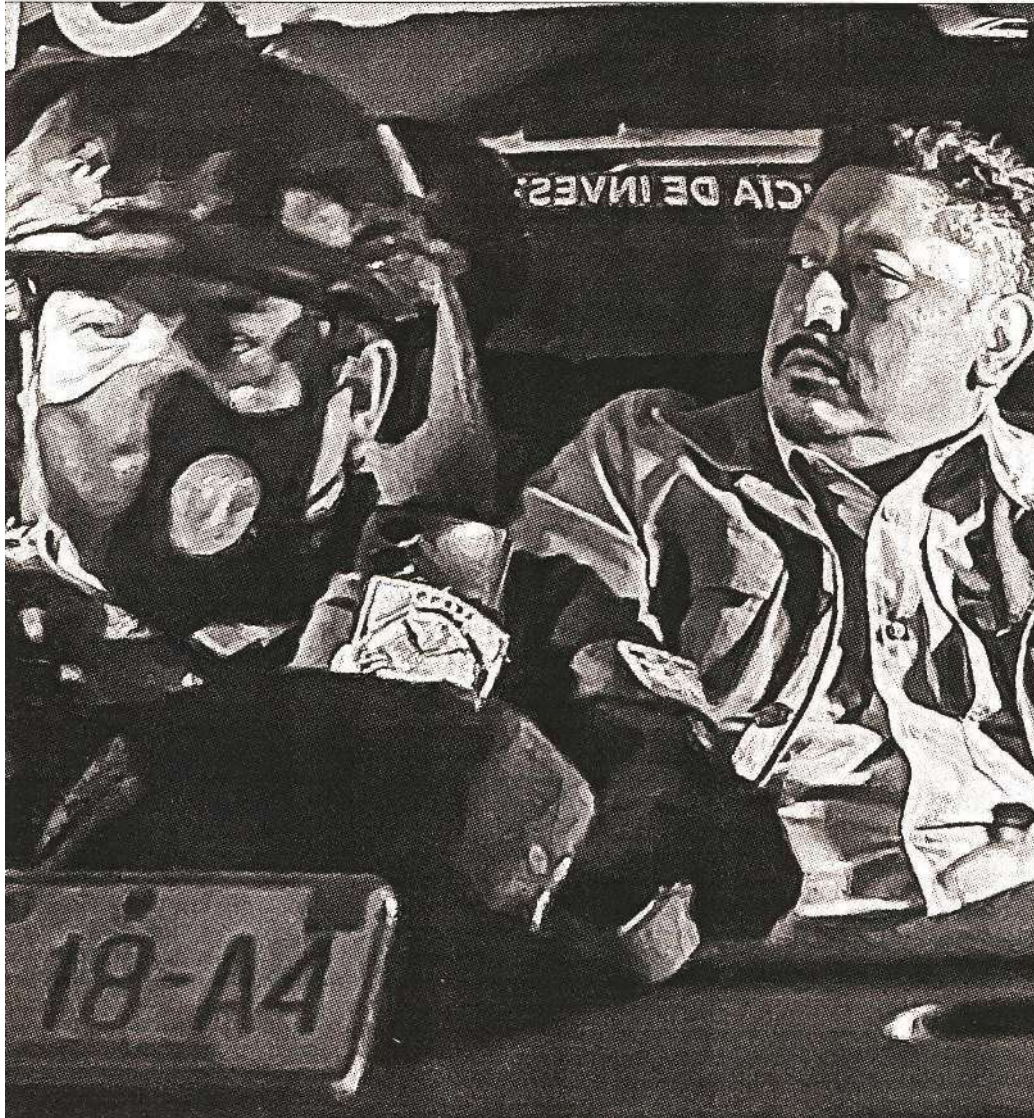
▲ El fiscal general de Justicia del estado de Morelos, Uriel Carmona, fue reaprehendido por elementos de la Fiscalía General de Justicia capitalina el viernes pasado al salir del Reclusorio Sur, luego de que tres jueces ordenaron su liberación. Ayer fue trasladado al penal de máxima seguridad en Almoloya de Juárez, estado de México.