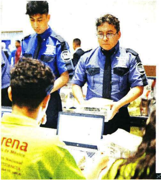
Representantes de Morena recibieron los paquetes y se inició el conteo en instalaciones del WTC.