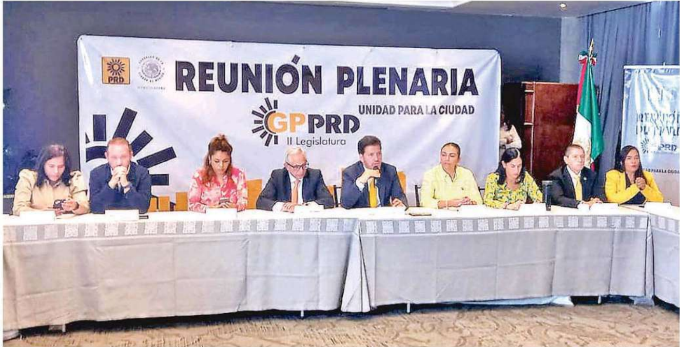
En la reunión de los congresistas se convocó a todos los que integran la Unión de Alcaldes de la Ciudad de México (UNA), emanados del PAN, PRI y PRD