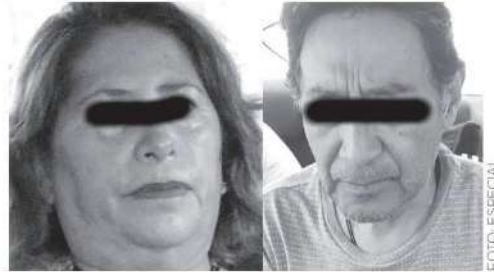
Detenidos por cómplices en feminicidio