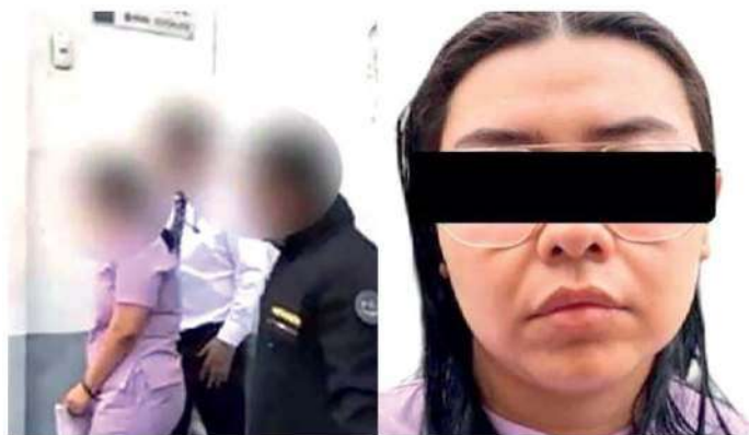
Se puso violenta con su pareja

La hoy detenida habría tratado de desviar las investigaciones al narrar que la víctima se arrojó por voluntad propia.