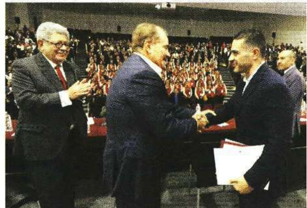
El dirigente y el aspirante, al término del 20 Congreso Nacional Ordinario del Sindicato del Metro.

“Sabemos reconocer liderazgos, hoy reconocemos su liderazgo, su preocupación genuina y constante por todos los integrantes de este gran Sindicato”.