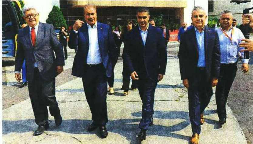
A la asamblea asistieron 500 delegadas y delegados, representantes e invitados especiales del SNTSTC