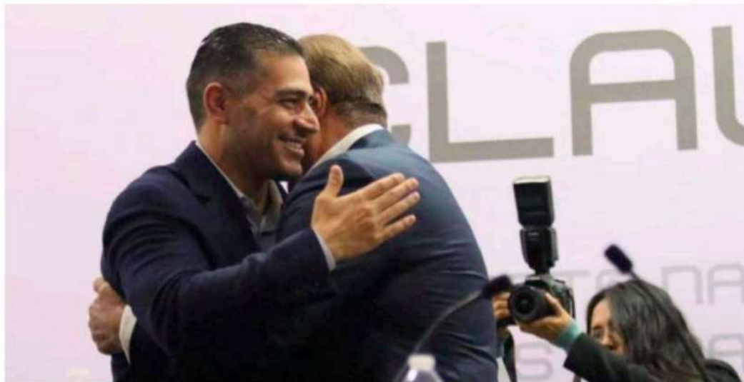
Omar García Harfuch estrechó lazos con el Sindicato Nacional de Trabajadores del Sistema de Transporte.