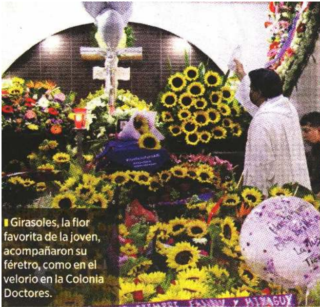
■ Girasoles, la flor favorita de la joven, acompañaron su féretro, como en el velorio en la Colonia Doctores.