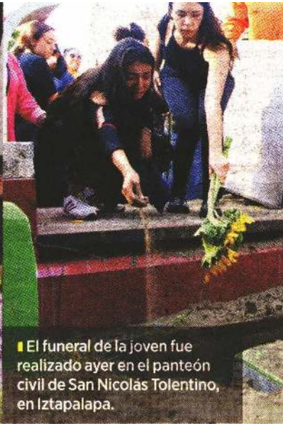
■ El funeral de la joven fue realizado ayer en el panteón civil de San Nicolás Tolentino, en Iztapalapa.