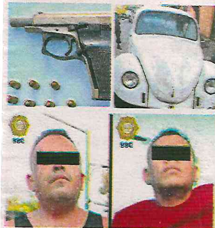
Fueron detenidos dos hombres, de 36 y 44 años de edad

Los oficiales le marcaron el alto y los implicados descendieron de la unidad e intentaron huir a pie, por lo que, metros adelante, fueron detenidos dos hombres, de 36 y 44 años de edad, a quienes en apego a los protocolos de actuación se les efectuó una revisión preventiva, tras la cual se les aseguró un arma de fuego corta, un cargador, siete cartuchos útiles y 15 envoltorios con una sustancia con las características de la cocaína.