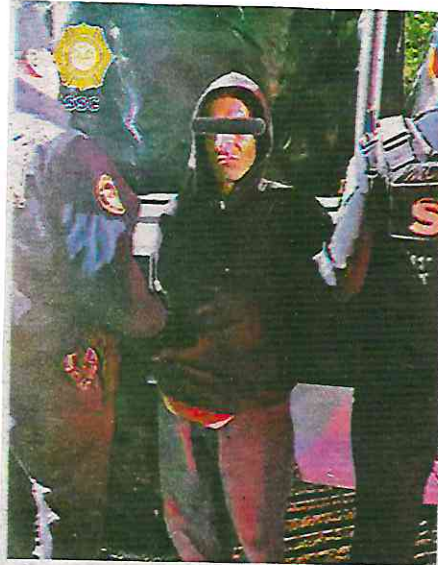
Detenido al parecer por agredir con un arma de fuego a un ciudadano, en la alcaldía Álvaro Obregón

Paramédicos de Protección Civil (PC) que acudieron diagnosticaron al hombre sin signos vitales por proyectil de arma de fuego en tórax lado izquierdo.