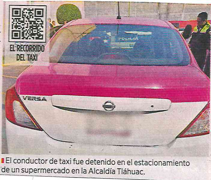
El conductor de taxi fue detenido en el estacionamiento de un supermercado en la Alcaldía Tláhuac.

Fue hasta después de la detención que los elementos identificaron su relación con el caso de Lidia. El taxi también fue asegurado en el sitio. El acompañante del hombre fue presentado ante el Ministerio Público.