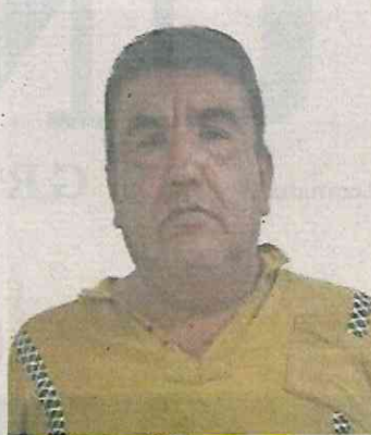
El taxista fue localizado por la denuncia de una mujer.

“En la @Alic Iztapalapa @SSC_CDMX detuvo a dos hom-