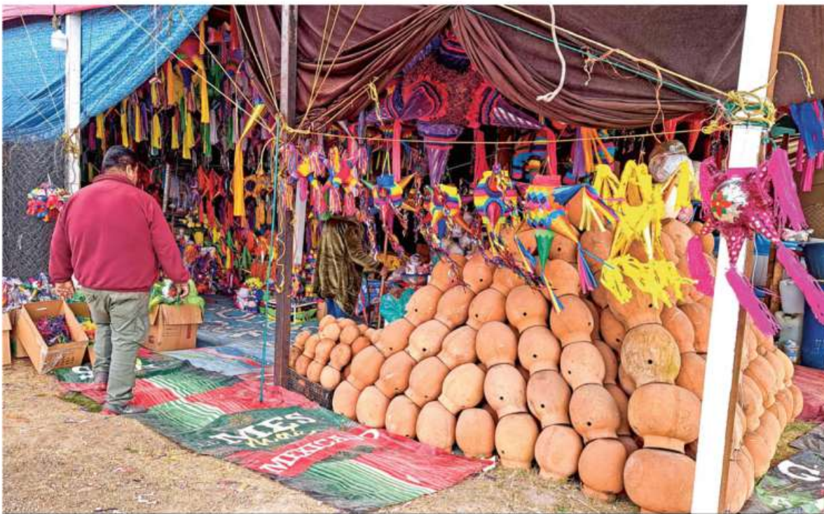
IDAIDE, DALE, DALEEEE! En la Central de Abasto de la Ciudad de México se instaló una romería navideña en donde se ofrecen piñatas, fruta de temporada, adornos y todos los artículos necesarios para la temporada navideña COMX P. 8

METRO CIERRA DESDE EL 17 DE DICIEMBRE TRAMO DE L9 POR OBRAS COMX P. 7