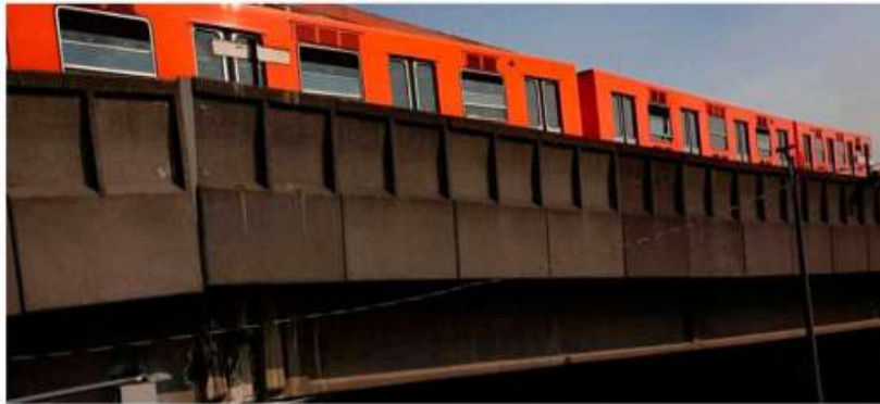
Se invertirán inicialmente 220 mdp en tramo elevado de Línea 9 del Metro.

Cabe señalar que en este proceso, la Secretaría de Obras desempeñará un papel central en el ámbito de la infraestructura, colaborando estrechamente con el Sistema de Transporte Colectivo (STC) Metro. Paralelamente, la Secretaría de Movilidad (Semovi) supervisará la implementación del transporte alternativo,