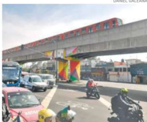
La reparación del tramo elevado tardará 5 meses

EL DIRECTOR del Metro agregó que la Línea 1, que opera a la mitad, está en posibilidades de atender una afluencia extra de pasajeros