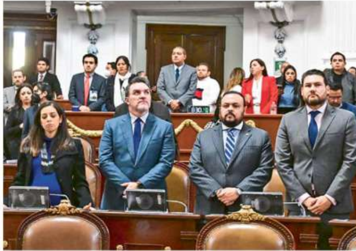
RECHAZO. Diputados del PAN votaron en contra de la controversia y argumentaron que el Tribunal Electoral protegió los derechos de su compañero de partido.

Con el respaldo de su bancada aseguraron que se debía acudir ante la Suprema Corte de Justicia de la Nación (SCJN) en contra de la resolución del Tribunal Electoral capitalino pues no posee facultades para otorgar licencias a los cargos públicos, pues se trata de un trabajo exclusivo del Poder Legislativo.