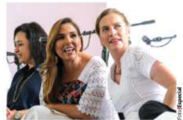
MARA Lezama, gobernadora de Q.Roo y Beatriz Gutiérrez, ayer en Bacalar.

México se desplomó 15 puntos; fue de los últimos 5 lugares; "diferencias no fueron significativas": Educación; se confirma que se necesitaba cambiar modelo, dice