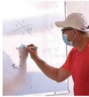
IGNACIO HUITZIL JPC. CERO DOWNLOAD

Bajan calificaciones de México en lectura, ciencia y matemáticas NACIONAL