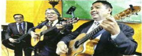
El Trio Los Tecos canta boleros en una cantina de la Colonia Escandón, en la CDMX.