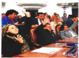
Luego de que el Congreso otorgara la licencia a Taboada, diputados de oposición celebraron la resolución.

Esto, luego de que Taboada presentó un juicio para la protección de sus derechos político-electorales ante el Tribunal Electoral local, debido a que no se le había aprobado su licencia en el Congreso y corría el riesgo de perder la precandidatura, recurso que resolvió el órgano electoral avalándole la licencia definitiva. ●