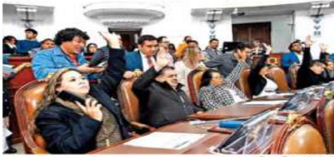
Los diputados avalaron no sesionar el 12 de diciembre.

Los últimos tres días del periodo ordinario de sesiones en el Congreso de la Ciudad de México serán decisivos; se prevé la discusión y votación de los dictámenes de la Ley de Ingresos y el Presupuesto de Egresos de 2024, y se podría someter a votación el dictamen sobre la ratificación de la fiscal local Ernestina Godoy.