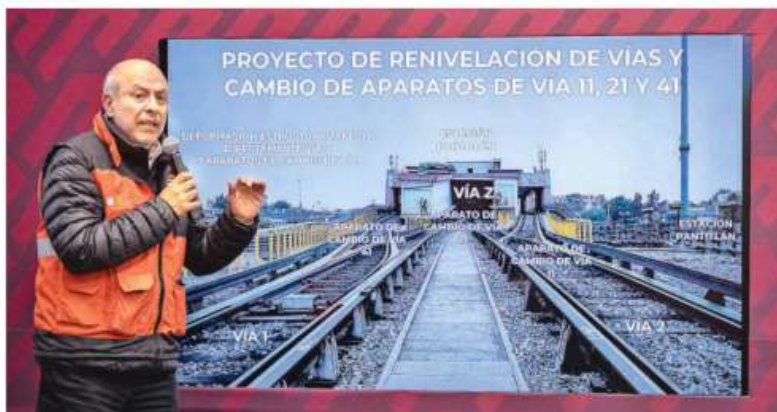
El desnivel en la línea está cerca de los 80 centímetros, detalló el director general del Metro, Guillermo Calderón.

El retiro del material y equipo será del 17 al 31 de diciembre, la renivelación, que correrá a cargo de la Secretaría de Obras y Servicios, se realizará del 1 de enero al 30 de abril de 2024, la instalación de vías y equipo a cargo del Metro se realizará del 15