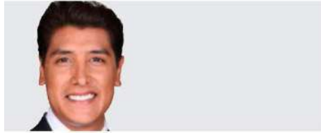
Juan Manuel Jiménez @juanmapregunta