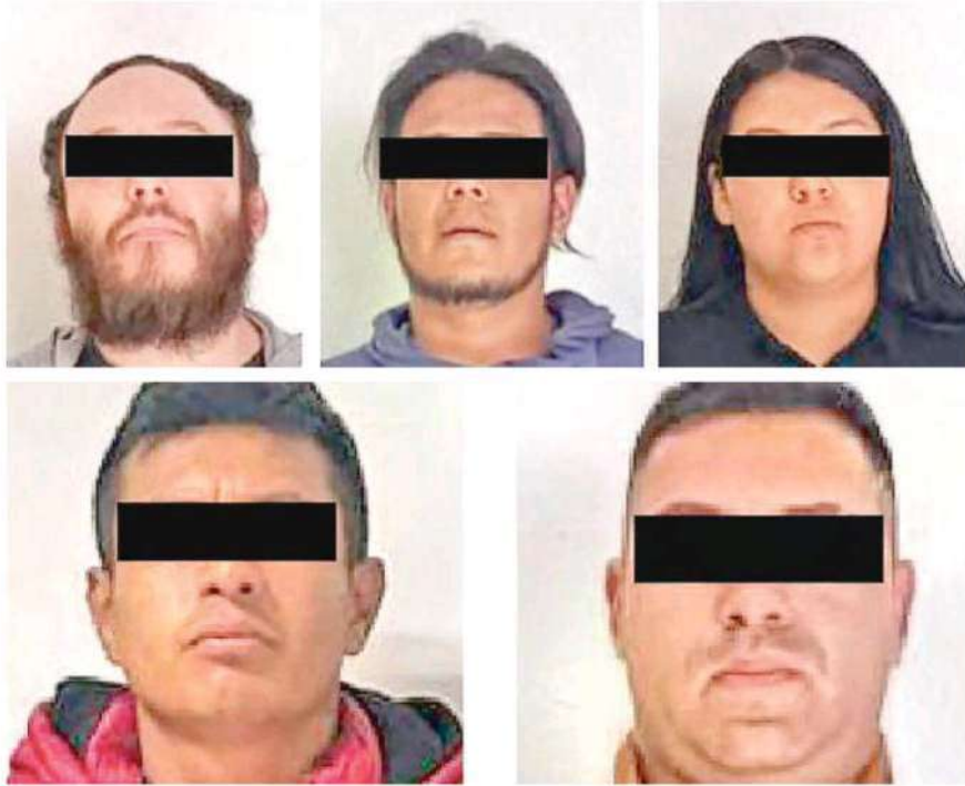
A los detenidos les leyeron sus derechos de ley y fueron puestos a disposición del agente del Ministerio Público