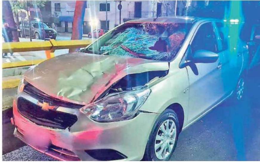
Tras en horrible accidente, el conductor detuvo el auto y solicitó apoyo a través del 911