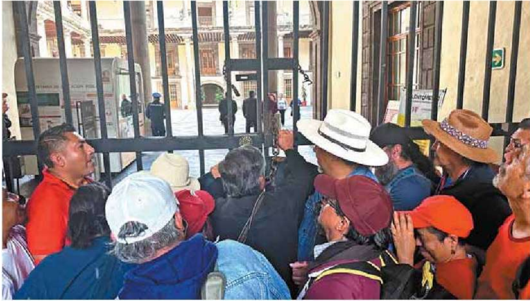
➤ Más de 5 mil educadores protestaron en calles de la entidad y solicitaron audiencia con Leticia Ramírez.