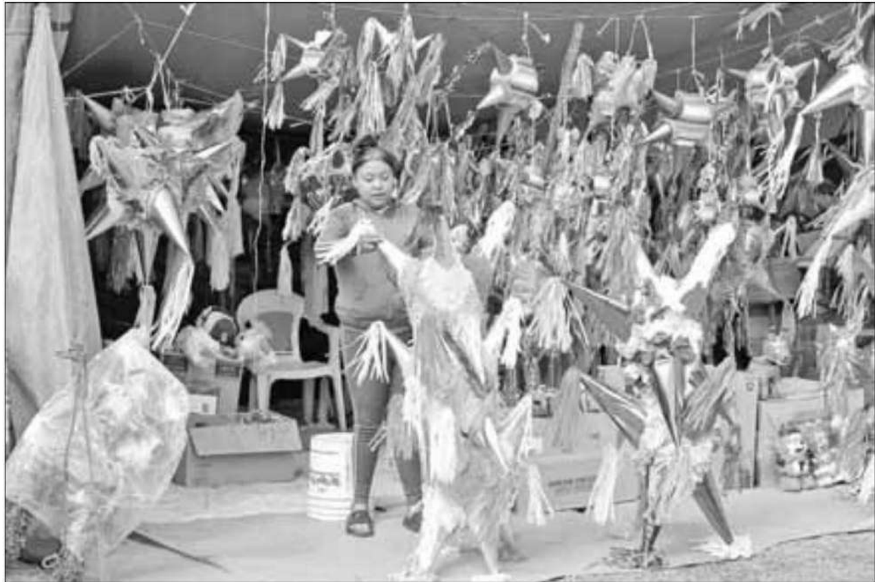
▲ Se ofrecen piñatas decorativas de 25 a 30 pesos y otras para romper en las posadas con precios de 74 a 850 pesos.