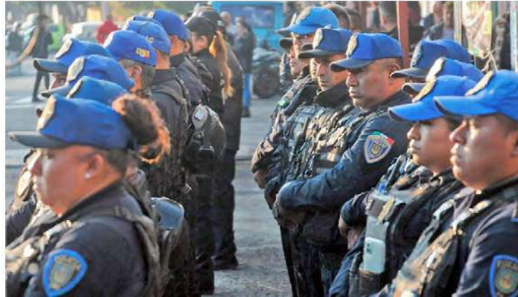
OPORTUNIDADES. En el Congreso local también se planteó elevar los montos de becas para hijos de los uniformados de la SSC.

“Solicitamos partidas para ampliar las capacidades académicas de los policías y tengan una carrera, que puedan prosperar y se les abran siempre las oportunidades que buscan en la vida”, dijo. /ÁNGEL ORTIZ