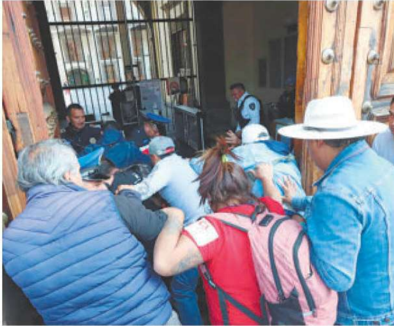
Maestros de la CNTE irrumpen en la SEP