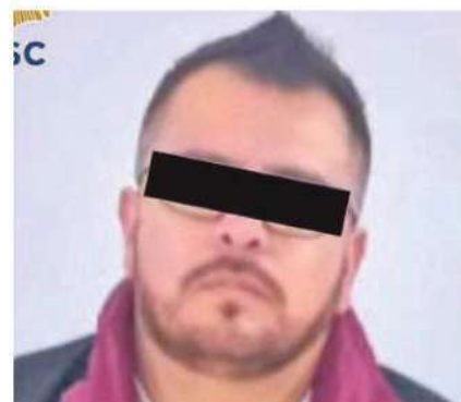
El conductor fue puesto a disposición del Ministerio Público

Al rededor de las cinco de la mañana el personal de la Fiscalía General del Justicia (FGJ) de la Ciudad de México realizó las diligencias y trasladaron el cadáver a la coordinación territorial correspondiente.