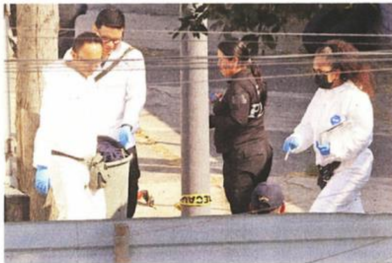
Los peritos recogieron un bote que, presuntamente, contenía extremidades humanas.

Policías de Investigación de la FGJ acudieron para rea-