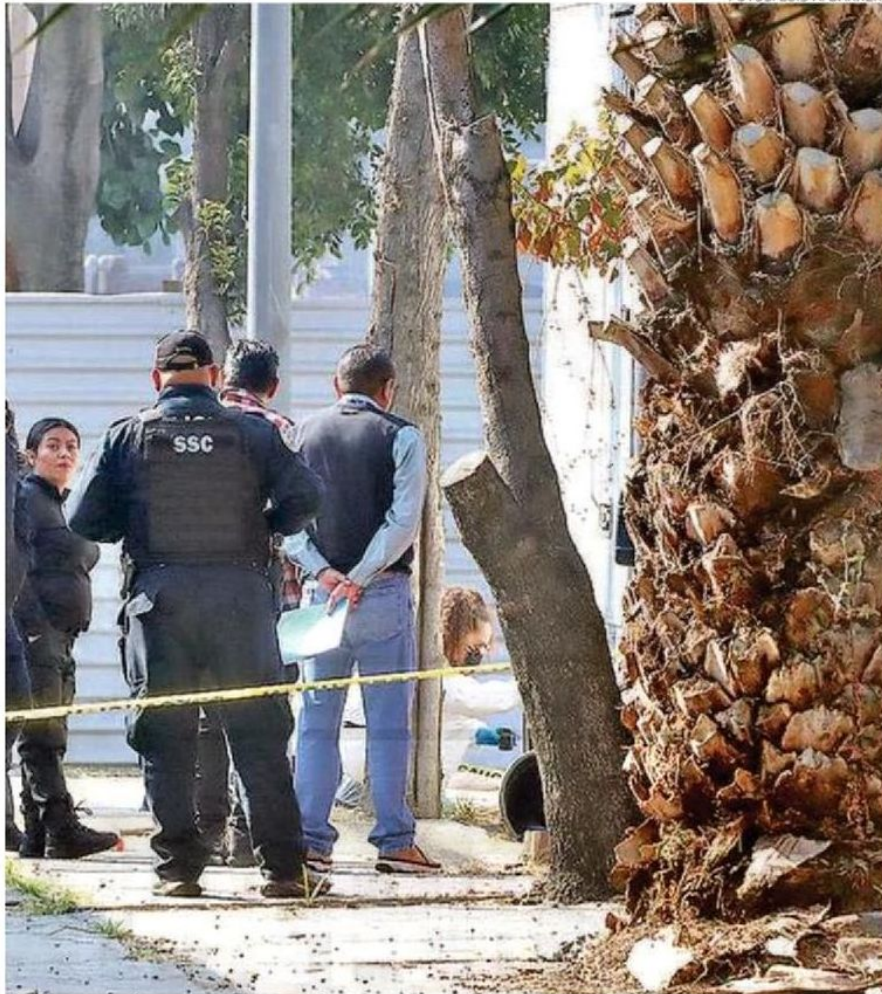
Los restos humanos, a escasos metros de una primaria, se encontraban en una bolsa negra y tapados con una cobija