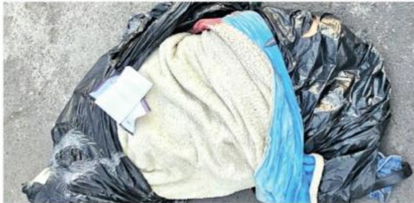
Lo envolvieron en una cobija