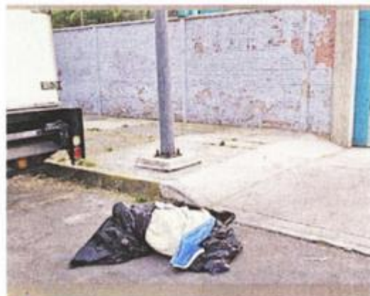
Un acceso al estacionamiento del Colegio de Bachilleres Plantel 10 se ubica cerca de la zona del hallazgo.

lizar las primeras indagatorias, a fin de dar con el paradero de los responsables de abandonar el cuerpo.