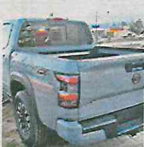
MX$26,883 2022 Nissan frontier Culhuacán CDMX 100 km