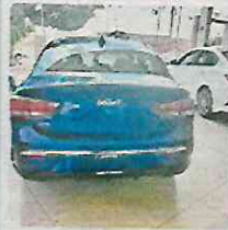
MX$10,000 2021 Toyota lex Mardacy Modwile 2022 y 2023 Culhuacán CDMX 100 km