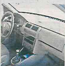
MX$12,000 2007 Volkswagen polo/ster Culhuacán CDMX 18 mil km