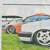
MX$58,000 1987 Volkswagen golf Culhuacán CDMX 14 mil km

Ofertan las unidades a través de Marketplace de Facebook.