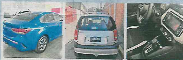
MX$15,000 2022 Kia rio Culhuacán CDMX 7 mil km

De acuerdo con la información consultada, en todos los casos las víctimas indirectas señalaron haber visto a varios sujetos implicados, quienes fingen que el vendedor está por llegar a la cita y posteriormente el resto de los delincuentes amedrentan a los compradores para apoderarse del dinero.