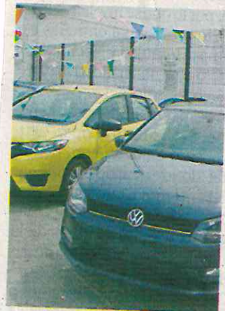
Los falsos vendedores ofertan los autos en redes sociales.