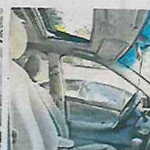
MX$79,000 2007 Toyota corolla Culhuacán CDMX 209 mil km