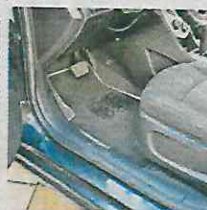
MX$120,000 2013 Chevrolet sonic Culhuacán CDMX 124 mil km