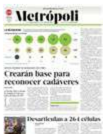
Gráfico: Rdofo Gómez García