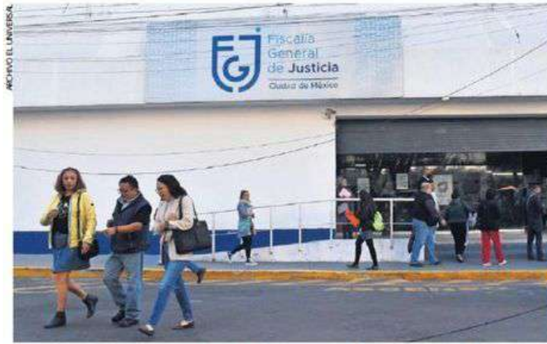
La fiscalía capitalina expone que implementará una mesa de atención con las víctimas de corrupción inmobiliaria que no pueden regularizar sus viviendas.

INMUEBLES se encuentran asegurados y bajo investigación.