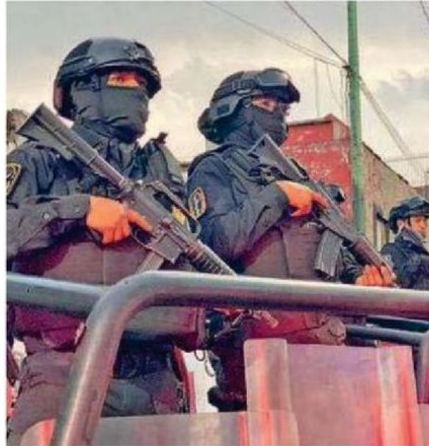
La estrategia de seguridad ha permitido la detención a esta fecha de 62 objetivos prioritarios