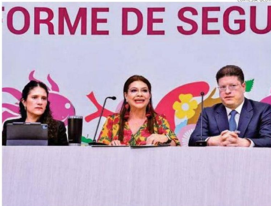
La mandataria capitalina aseguró que el robo de vehículo (con y sin violencia) suma una disminución conjunta del 22% respecto a 2025

El robo a persona en espacio público cayó un 6% comparado con 2019, pasando de 55 casos diarios a 17 en la actualidad. Respecto a los homicidios, se contabilizaron 16 carpetas de investigación menos en este periodo