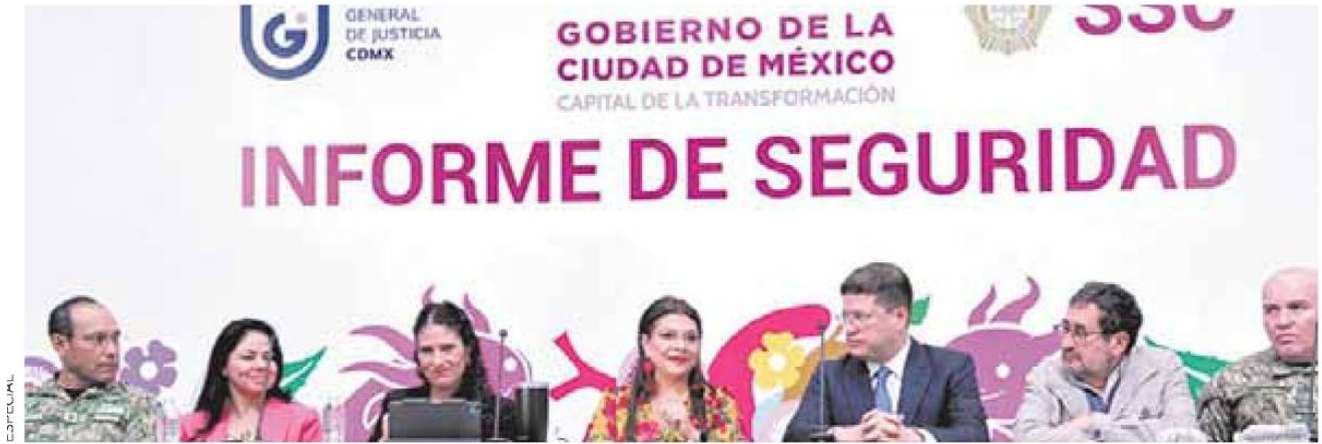
⊕ Clara Brugada (centro), jefa de Gobierno, ayer en el informe.