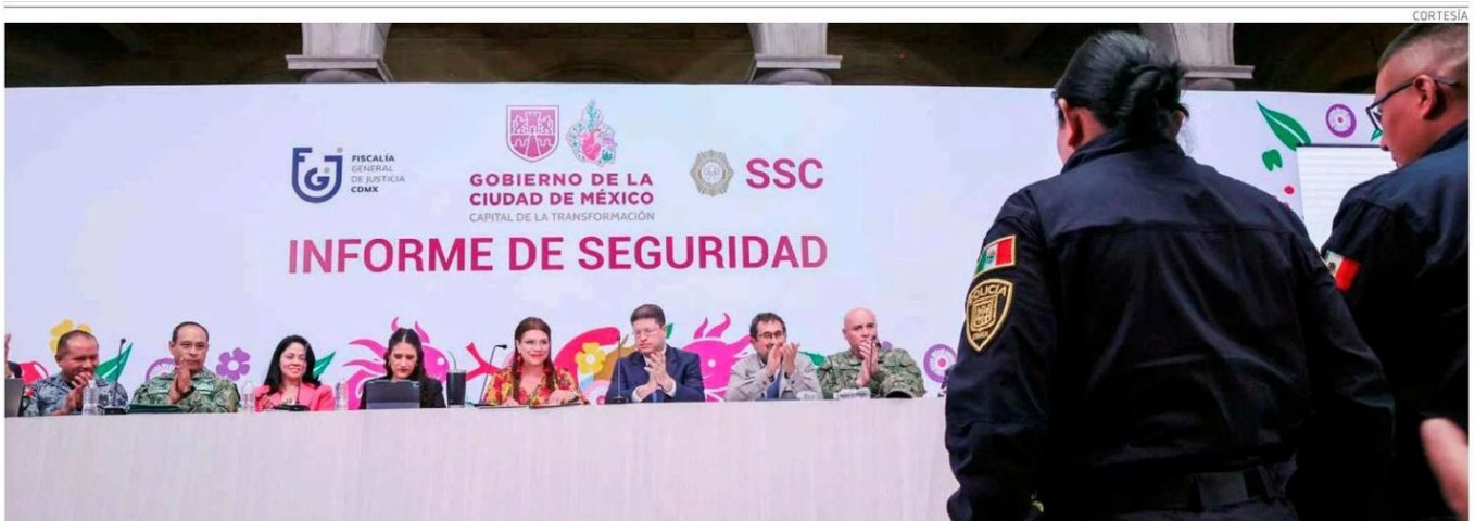
La jefa de Gobierno Clara Brugada encabezó la presentación del informe de seguridad del mes de marzo en la capital.

La Fiscalía ha concentrado su trabajo en delitos graves como homicidio, robo a casa habitación y robo a vehículos, contribuyendo a una reducción sostenida de la impunidad en la ciudad.