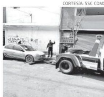
Reporte del primer trimestre 2026

Este programa tiene como objetivo mejorar la movilidad, reforzar la seguridad y recuperar espacios públicos, promoviendo una convivencia ordenada en la vía pública, por lo que se invita a la población a respetar las normas de tránsito y colaborar con las autoridades para contribuir a una comunidad más segura y ordenada.