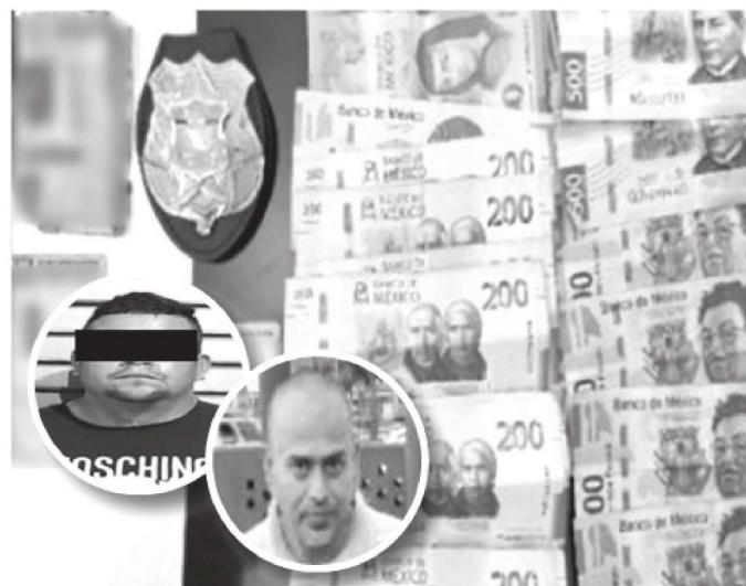
Intimidaban a sus víctimas

Los detenidos fueron presentados junto con lo asegurado ante el agente del Ministerio Público correspondiente, quien determinará su situación jurídica.