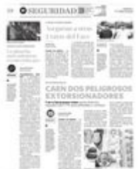
Atrapados en la maroma