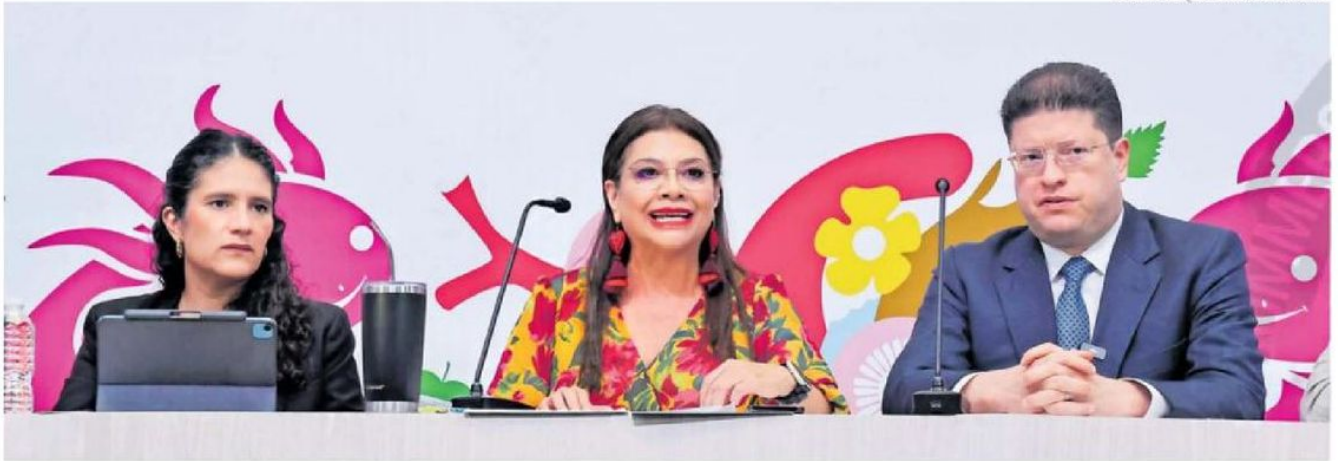
Autoridades del gobierno capitalino, durante el informe de seguridad.