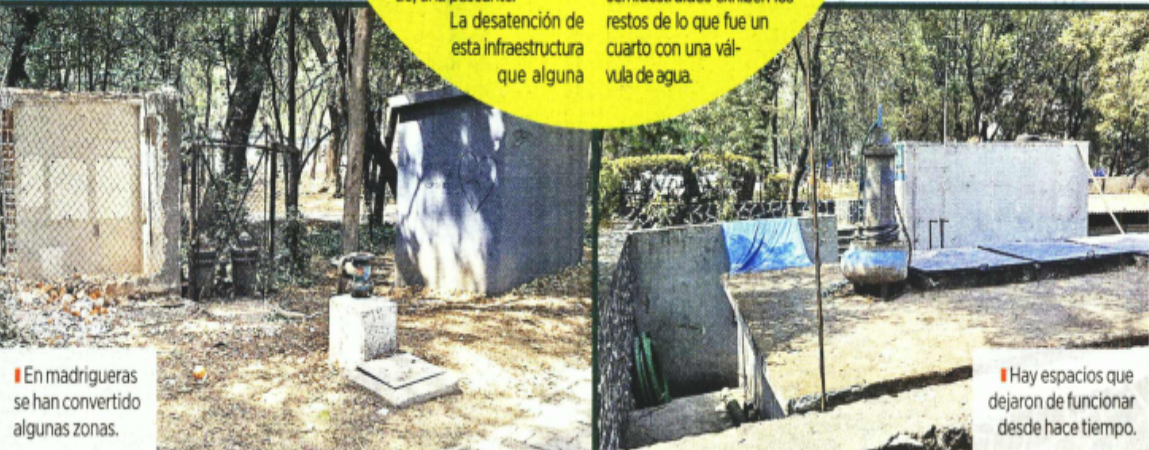
En madrigueras se han convertido algunas zonas.