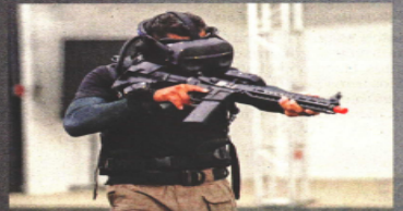
Se evalúan cómo se toma un arma, pues debe hacerse con cuidado y técnica.