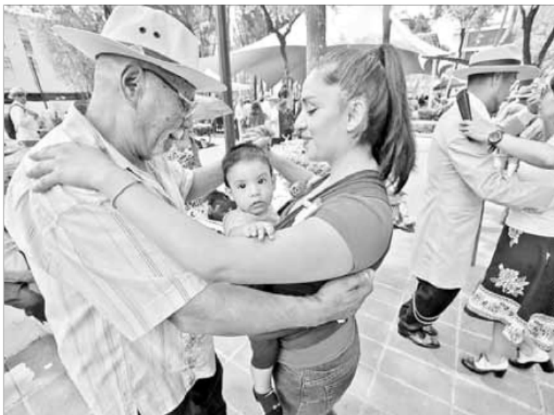
▲ En algún momento, las nuevas generaciones se moverán al ritmo del danzón.