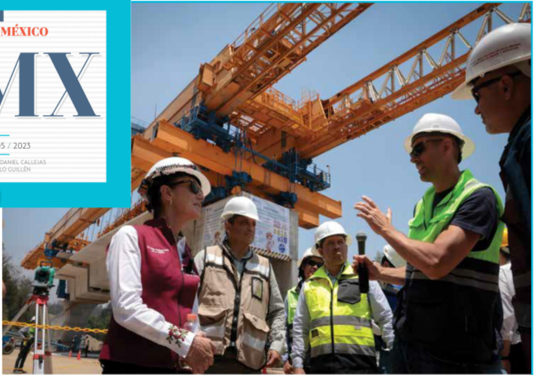
• MOVILIDAD. La jefa de Gobierno destacó la importancia de la obra que ayuda a conectar el Edomex con la ciudad.

L a jefa de Gobierno de la CDMX, Claudia Sheinbaum Pardo, supervisó este sábado dos obras que permitirán agilizar la movilidad de los capitalinos: La renovación de la Línea 1 del Metro y el Tren Interurbano.