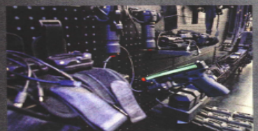
El armamento que se utiliza en el centro tiene el mismo peso y retracción que uno real.