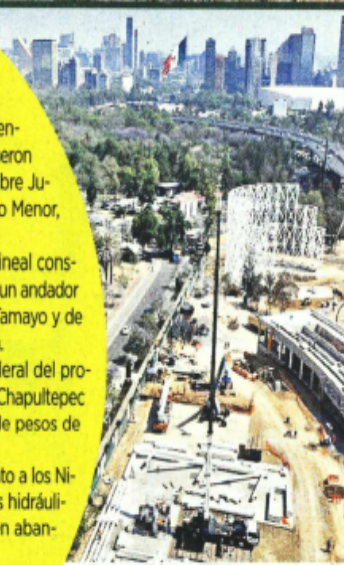
AZTLÁN Una lana soltaron para el parque de diversiones.