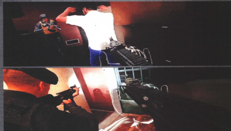
EL UNIVERSAL tuvo acceso a la capacitación de cuatro agentes para liberar a personas secuestradas. Las imágenes corresponden a la simulación que experimentaron en realidad virtual.