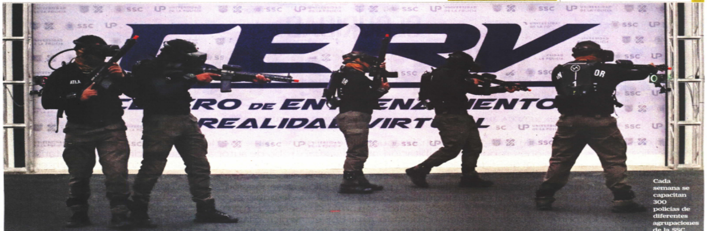
Cada semana se capacitan 300 policías de diferentes agrupaciones de la SSC.

Texto: KEVIN RUIZ —metropoli@eluniversal.com.mx Video: DIEGO PRADO