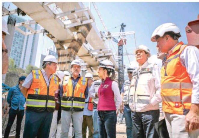
La jefa de Gobierno supervisa trabajos en los frentes que corresponden a la estación Santa Fe, el segmento Estado Mayor y la terminal Observatorio

tabletas, así como de un aparato de vía para que el tren pueda hacer un movimiento reversible hacia la terminal Zinacantepec, en Toluca.