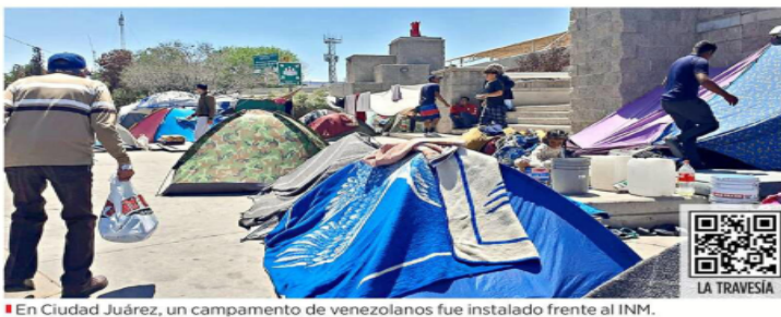
En Ciudad Juárez, un campamento de venezolanos fue instalado frente al INM.

El flujo de venezolanos se había ralentizado en el último trimestre de 2022, luego de que EU anunciara, el 12 de octubre, un nuevo procedimiento de admisión pa-