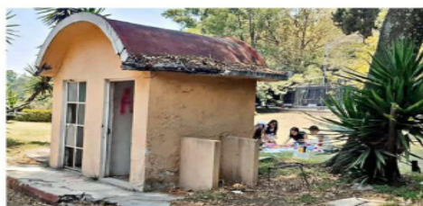
Pese a los malos olores y abandono, algunos hacen picnics.

La desatención de esta infraestructura que alguna vez fue comercial, es todavía más notoria, pues está en el perímetro de museos, justo en la entrada donde en 2011