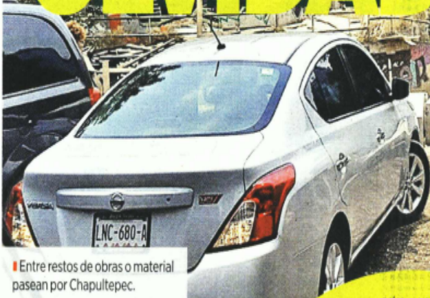
Entre restos de obras o material pasean por Chapultepec.

INVIERTEN 7 MIL MILLONES DE PESOS EN 3 AÑOS AL BOSQUE DE CHAPULTEPEC, QUE LUCE ABANDONADO