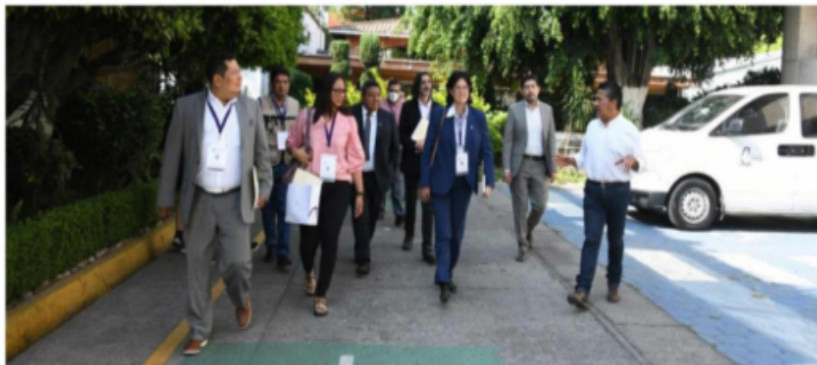
El ejercicio de participación ciudadana tendrá observación nacional e internacional para enchular colonias de la ciudad.

Este domingo los vecinos de las 16 alcaldías están llamados por el Instituto Electoral de la Ciudad de México a exigir, nuevamente, su derecho a que tres por ciento