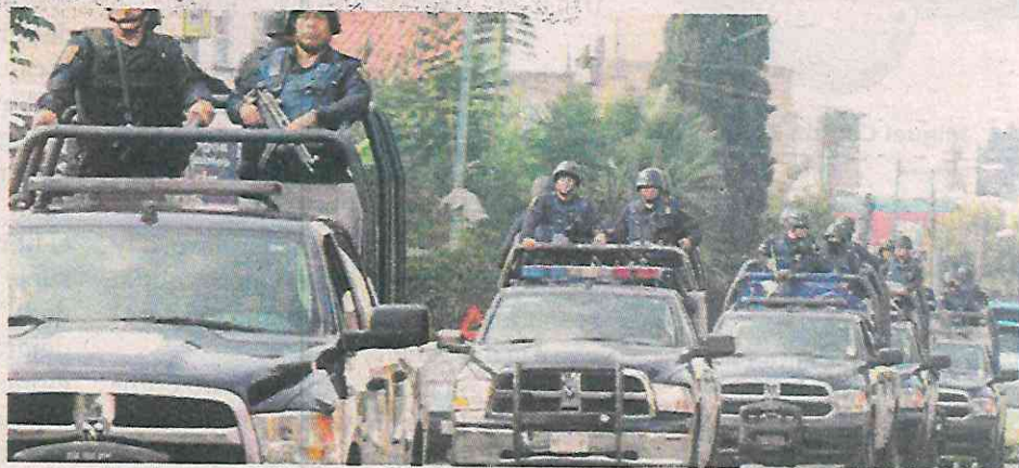
Los operativos, fallidos e insuficientes

Recordó que el tema de los feminicidios es “gravísimo en Tláhuac”, pues en menos de dos meses, tres cuerpos fueron localizados en esa alcaldía,