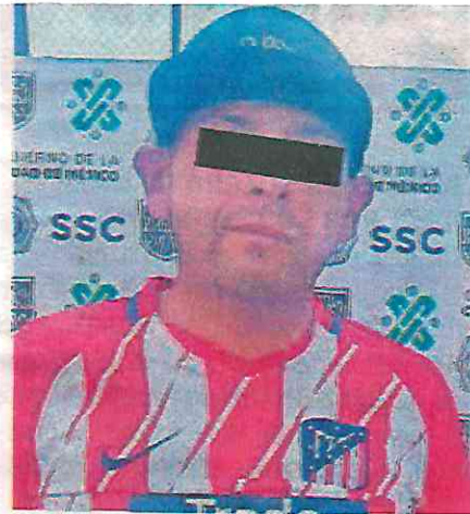
Videograbado sometiendo a un automovilista a quien asaltó con violencia