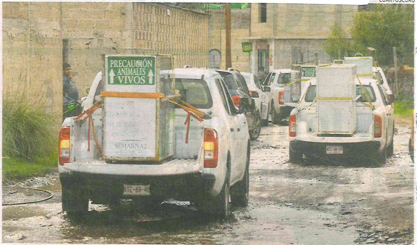
Así sacaron de la fundación a ocho leones en estado crítico cuyo destino ahora es el zoológico de Chapultepec