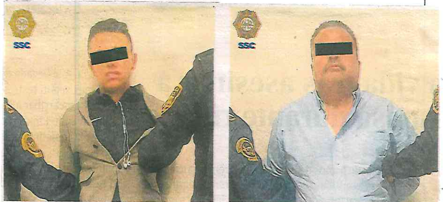
Ambos se harían pasar como comensales para despojar de relojes a clientes

Además, cuenta con cinco carpetas de investigación por el delito de robo a transeúnte con violencia, en los años 2020, tres en 2021 y una en 2022, en las alcaldías Coyoacán, Álvaro Obregón e Iztacalco.