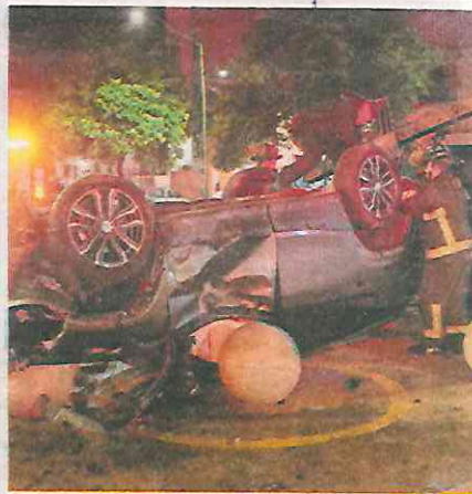
Su alocada carrera fue detenida tras volcarse aparatosamente

Fue durante la madrugada de este miércoles alrededor de las 02:30 horas que el conductor de una camioneta de lujo color gris transitaba a alta velocidad sobre Avenida de los Insurgentes Norte, cuando perdió el control del volante por lo que volcó dando algunos giros entre Prolongación Aldama y San Simón.