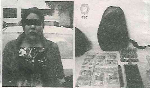
La mujer se libró de la golpiza, el hombre no

Los policías les encontraron una mochila con un celular y dinero en su interior; los afectados aseguraron que el efectivo era de sus pagos por derechos de piso. La mujer de 21 años y el hombre de 22 años quedaron detenidos.