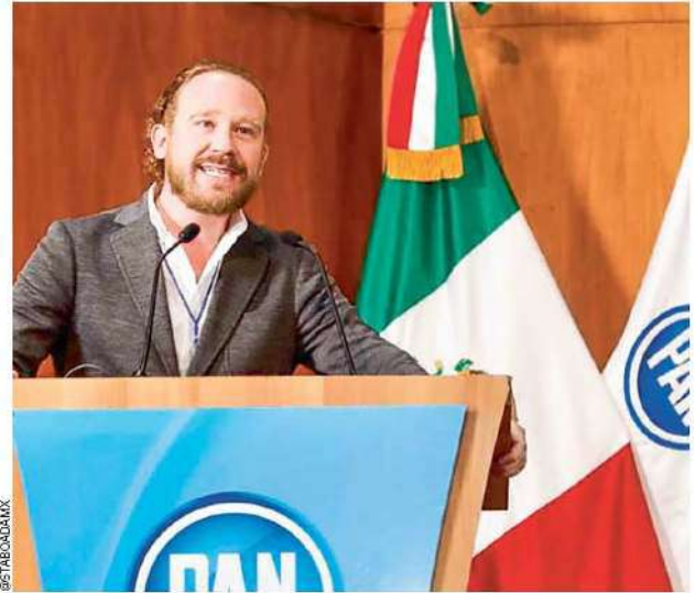
IG: TABOADA MX