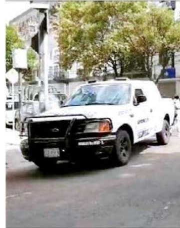
ATAQUE. Los delincuentes estaban armados y huyeron a bordo de tres motocicletas.

La SSC detalló que con apoyo de los monitoristas del Centro de Comando y Control (C2) se realiza un análisis en las cámaras de videovigilancia y se mantiene un despliegue en la zona para ubicar a los responsables.