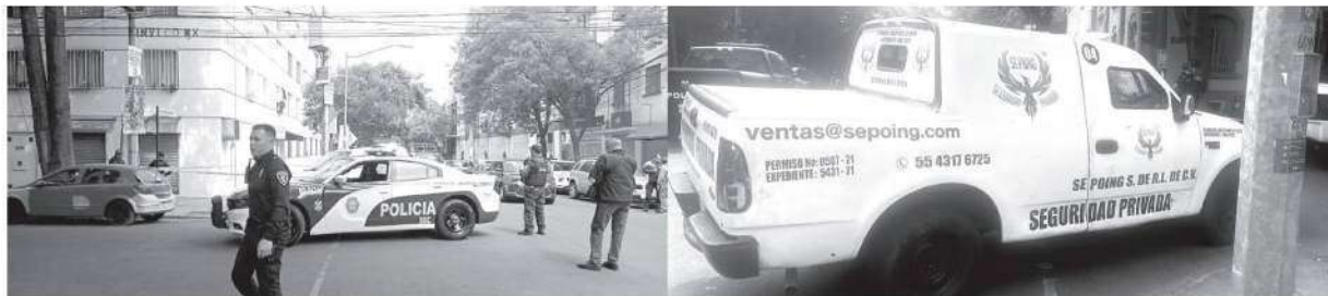
Los delincuentes pretendían llevarse a los custodios con todo y camioneta

La policía ubicó una de las motos de los delincuentes y ya son buscados en distintas zonas