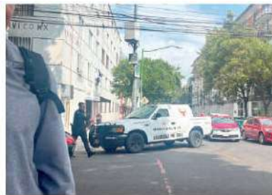
AYER fue asaltada una camioneta de valores en la colonia San Rafael.

De acuerdo con la SSC, elementos de la Policía capitalina se desplegaron al lugar, en donde las víctimas explicaron que tras estacionar el vehículo, uno de los empleados que caminaba sobre la acera fue interceptado por varias personas que viajaban en tres motocicletas; al hombre lo despojaron de una mochila con dinero en efectivo cuyo monto, de acuerdo con información extraoficial, era de cerca de 700 mil pesos.