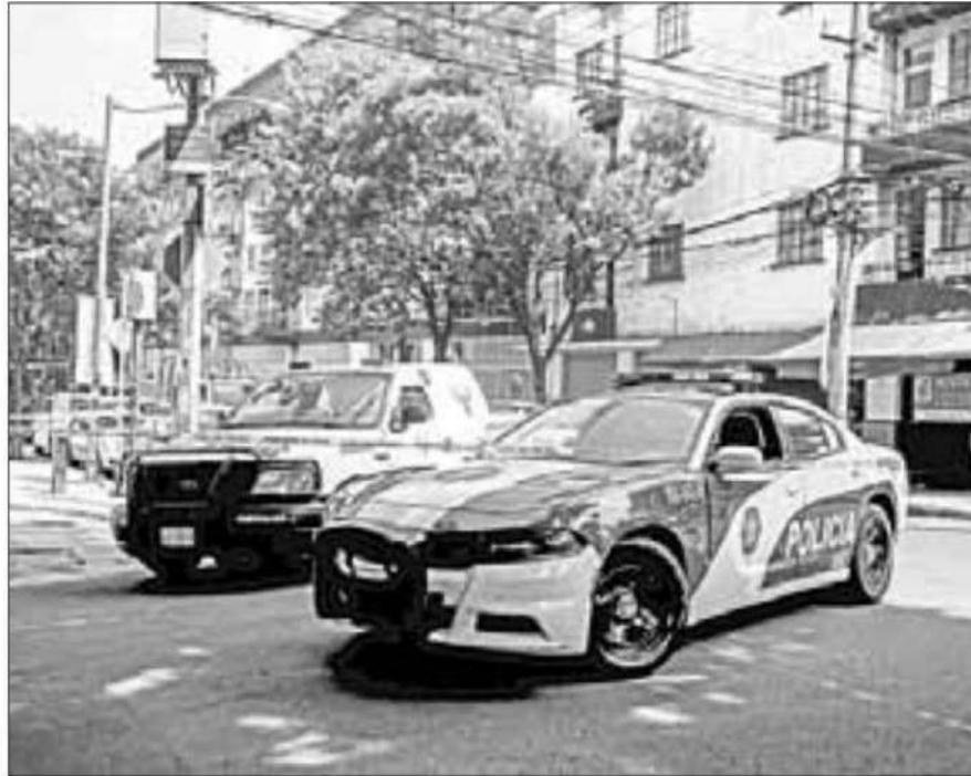
▲ Una fuerte movilización policial se desplegó en la colonia San Rafael luego de que cinco sujetos en motocicleta asaltaron una camioneta de valores, despojando a los custodios de un millón de pesos.