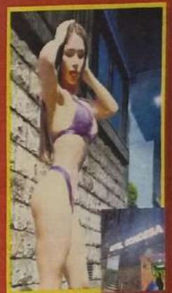
La mujer transexual presumía su lugar de trabajo, en sus redes.