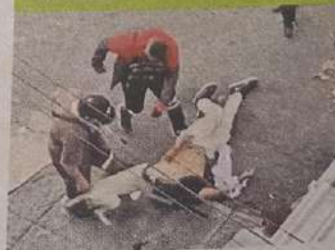
Hasta un perro, 'echó una pata' y quiso morderlo.