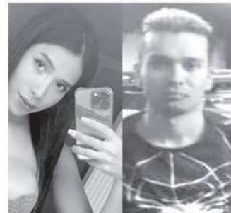
El responsable fue detenido

De acuerdo a informes de la policía, el sujeto detenido por el femicidio estuvo preso por abuso sexual