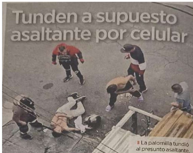
La palomilla tundió al presunto asaltante.