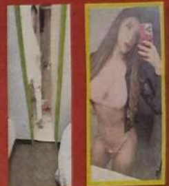
Su cuerpo fue localizado en un baño del hotel Condesa.

Una de las fotos más atrevidas que compartió fue justamente en plena calzada de Tlalpan, frente al hotel donde laboraba por las noches.