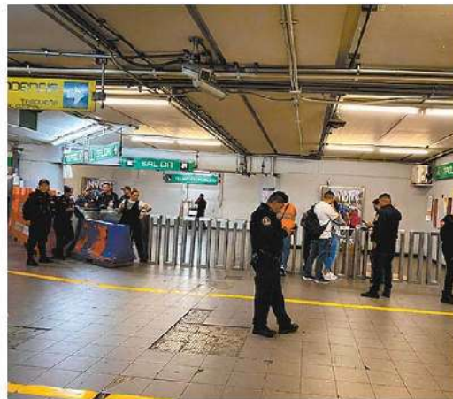
⊕ Minutos antes de las 23:00 horas, del pasado miércoles se suscitó este asesinato en la Línea 8.

Según el mandatario, el móvil del ataque fue un robo de 15 mil pesos, al tiempo que indicó que debido a esta agresión otro ciudadano resultó herido.