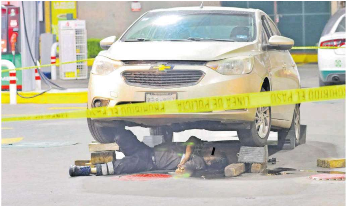
Varias fueron las horas que el cuerpo de la víctima que se desempeñaba como despachador permaneció bajo el automóvil sobre un charco de sangre