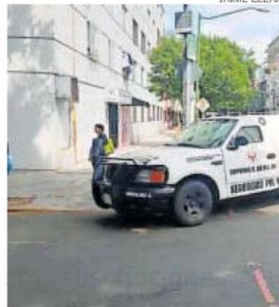
Cinco sujetos se llevaron el dinero del transporte.