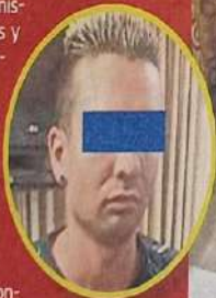
Su agresor fue detenido.