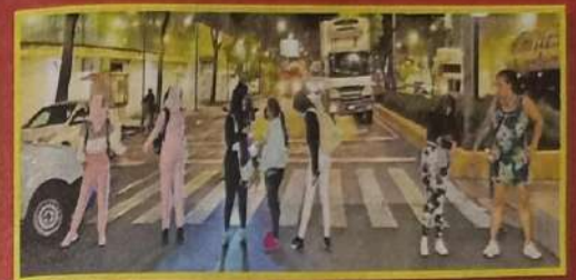
Trabajadoras sexuales realizaron bloqueos para exigir que se haga justicia.