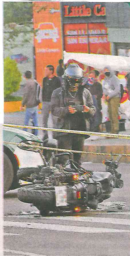
El percance ocurrió en Héroes de Padierna; al parecer la pareja iba a una rodada del club