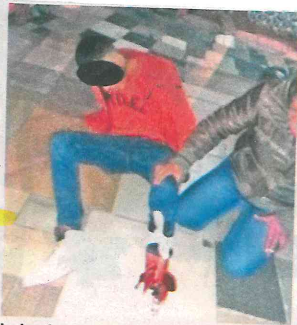
Lesionado por arma de fuego en la colonia Observatorio

Al lugar se presentó Raúl, padre del lesionado, quien acompañó a su hijo en el traslado al hospital y agradeció el apoyo.