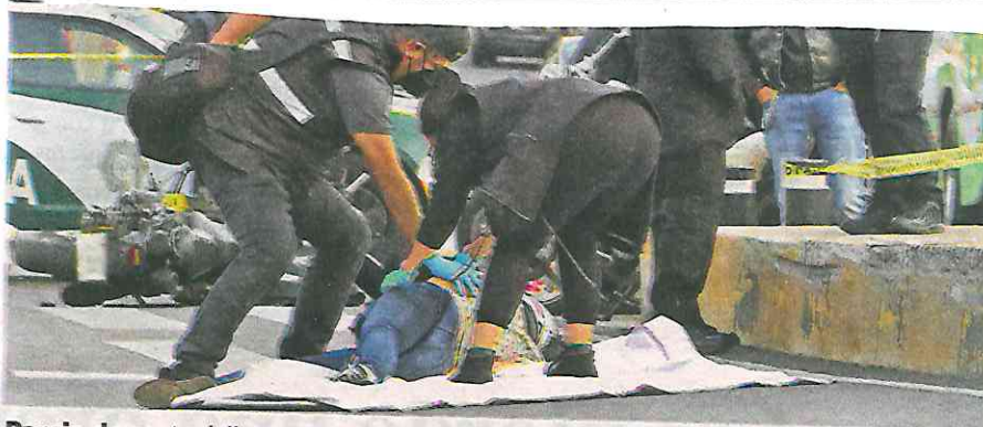
Pareja de motociclistas se accidenta sobre la carretera Picacho-Ajusco; la copiloto murió

bordo de una ambulancia hacia el Hospital General Ajusco Medio.