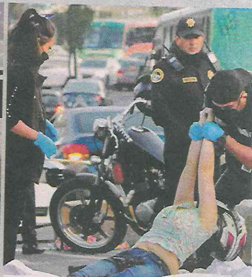
El accidente se registró sobre la carretera Picacho-Ajusto, a la altura de Calle Tekal.