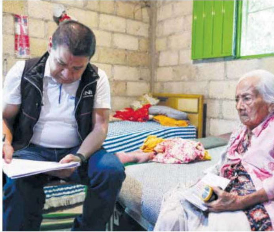
Las personas postradas también tienen derecho al voto