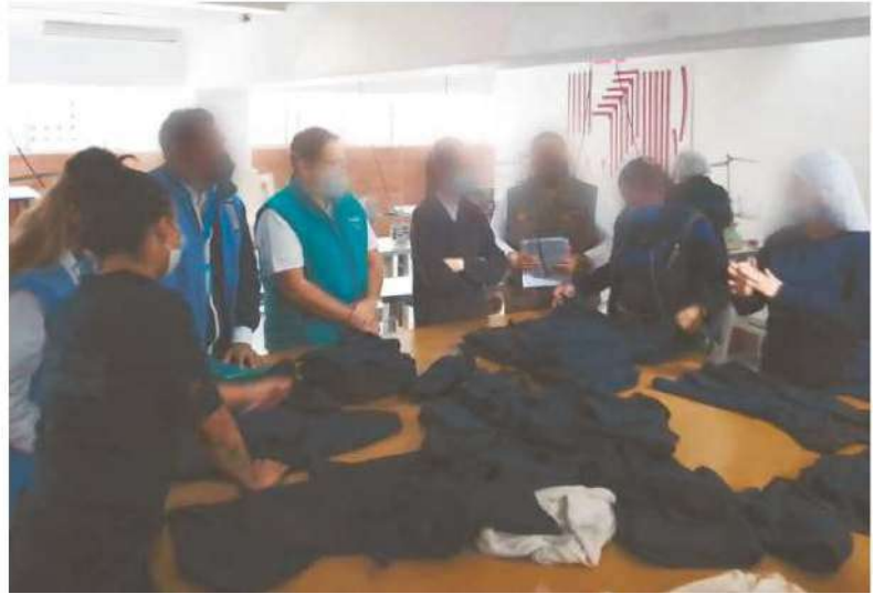
Seis de cada 10 mujeres en prisión consideran que les será complicado encontrar un trabajo al salir