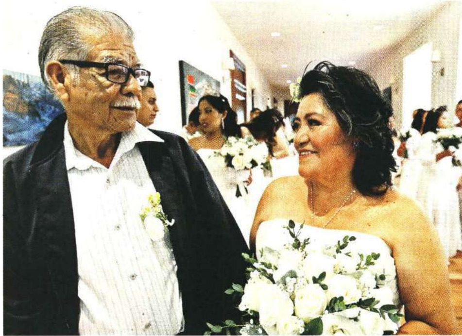
NUNCA ES TARDE. Catorce personas liberadas y dos parejas privadas de la libertad se casaron ayer en el Complejo Cultural Los Pinos.