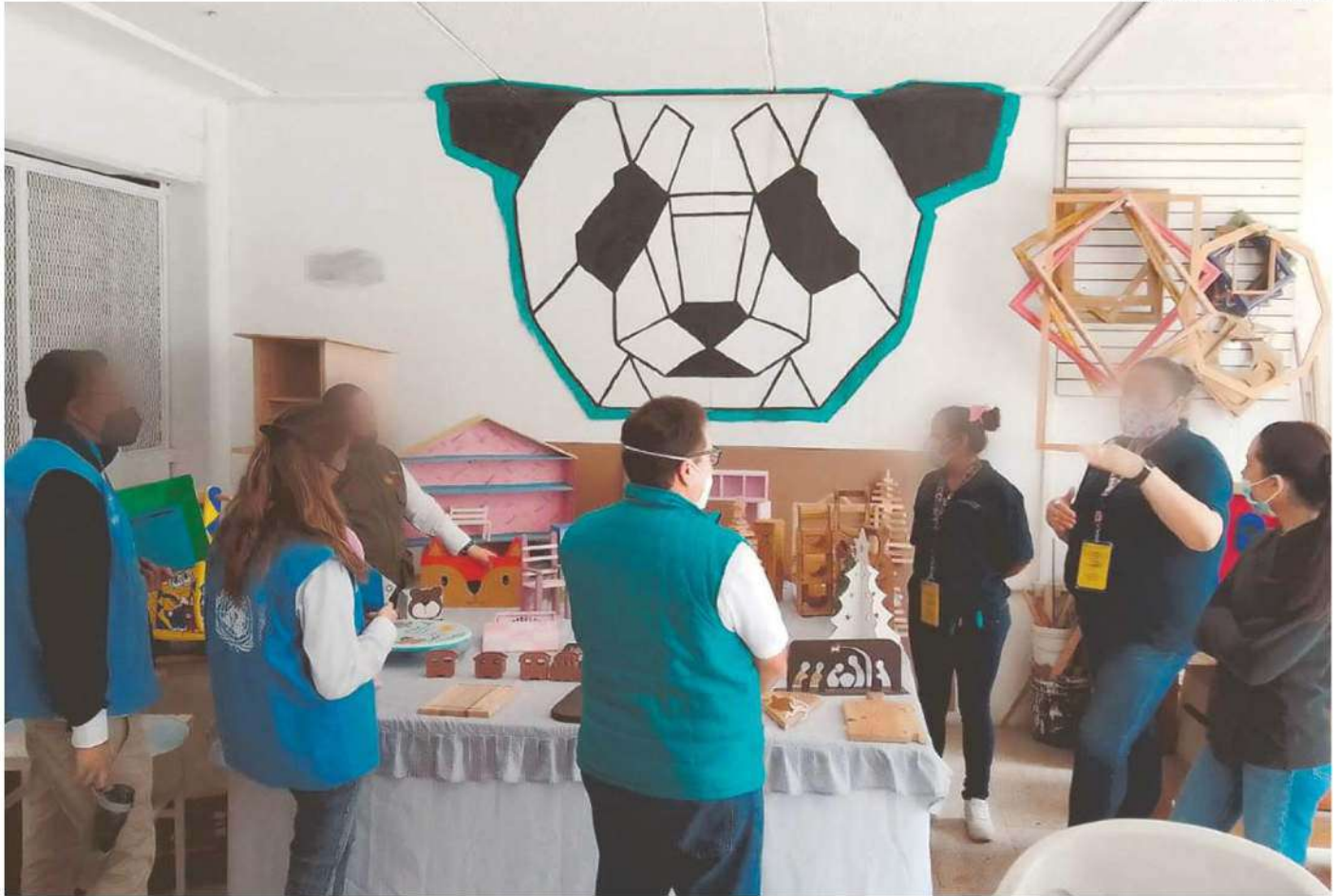
Desde hace casi cinco meses, Santander y la ONU cuentan con esta iniciativa de educación financiera en centros penitenciarios de la Ciudad de México