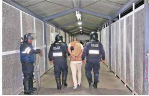
El traslado de indiciados es responsabilidad del sistema penitenciario