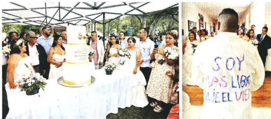
■ Para la mayoría de los contrayentes se trató de un cambio de vida y una forma de empezar.