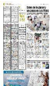
Las parejas contrajeron matrimonio en la casa Miguel Alemán, en Los Pinos, como parte de la segunda edición del Festival Iberoamericano de la Libertad.