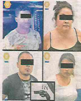
Detectados por las cámaras tras herir a un hombre y escapar

Operadores del Centro de Comando y Control C2 Norte, alertaron a elementos de la Secretaría de Seguridad Ciudadana (SSC) , sobre detonaciones por arma de fuego, en calle Nación casi esquina con 21 de Marzo, en la colonia Laguna Ticomán.