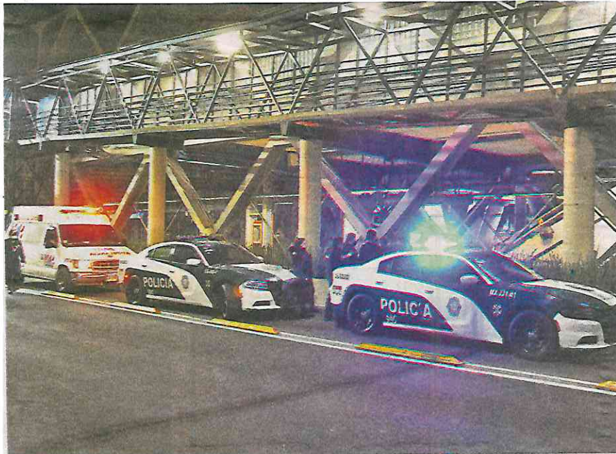
El hombre quería arreglar sus problemas quitándose la vida

Ahí la autoridad decidirá si tiene algún cargo por este incidente que provocó intensa movilización de servicios de emergencia, en Eje 3 Oriente Francisco del Paso y Troncoso, a la altura de la calle Apatlaco, en la colonia del mismo nombre.