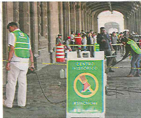
Entre las sanciones por infracciones de tránsito se encuentra el trabajo comunitario

Como lo dio a conocer El Sol de México , la pandemia llevó a un impase al programa de fotocívicas. Primero porque por medidas sanitarias se redujo al personal que hace trabajo de gabinete para calificar una foto captada por un radar o una cámara como infracción válida, y segundo porque las notificaciones, al hacerse de manera personal, fueron detenidas.