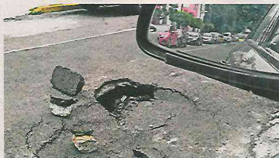
RIESGO. Un bache puede provocar que un auto pierda una llanta, pero a un motociclista le puede quitar la vida.