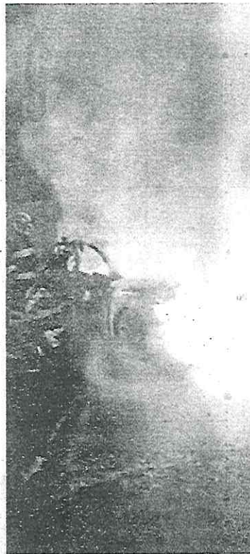
Quedó convertido en cenizas

El auto incendiado fue trasladado a un depósito por una grúa de tránsito de la Secretaría de Seguridad Ciudadana (SSC).