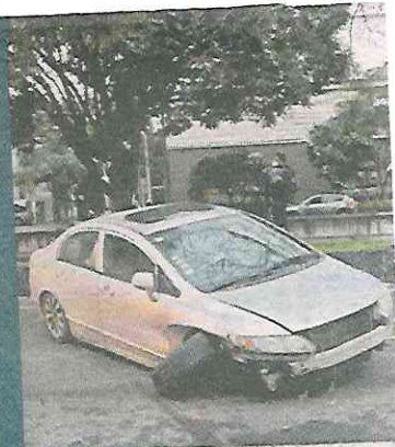
■ Al coche se le zafó una llanta, por eso chocó contra la pipa de gas.

Paramédicos acudieron, pero nadie resultó lesionado. ELTHON GARCÍA