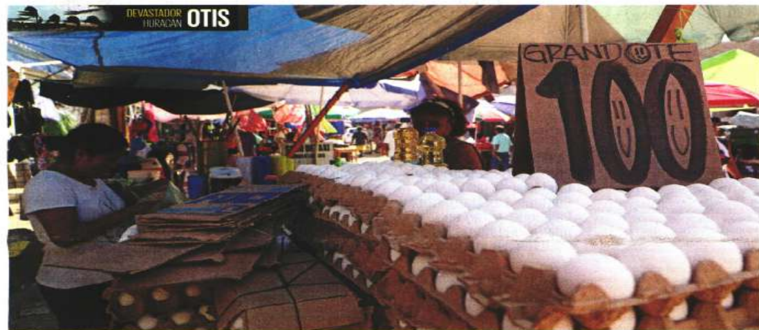
En el mercado el cartón de huevo se llega a vender en 100 pesos; pobladores señalan que faltan productos básicos y los que hay registran alza de precios.

767 MILLONES DE PESOS es la disminución contemplada de recursos al Tribunal Electoral.