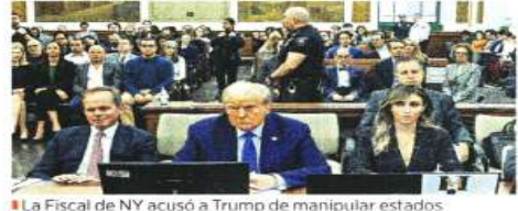
La Fiscalía de NY acusó a Trump de manipular estados financieros para estafar a bancos y aseguradoras.

Mandatario, que duró aproximadamente cuatro horas, contenía reiterados comentarios fuera de lugar y quejas sobre el caso, sobre la Fiscalía y el juez que decidirá el fallo, Arthur F. Engoron.