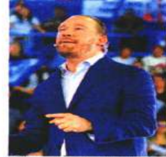
Santiago Taboada afirmó que está listo para ganar.