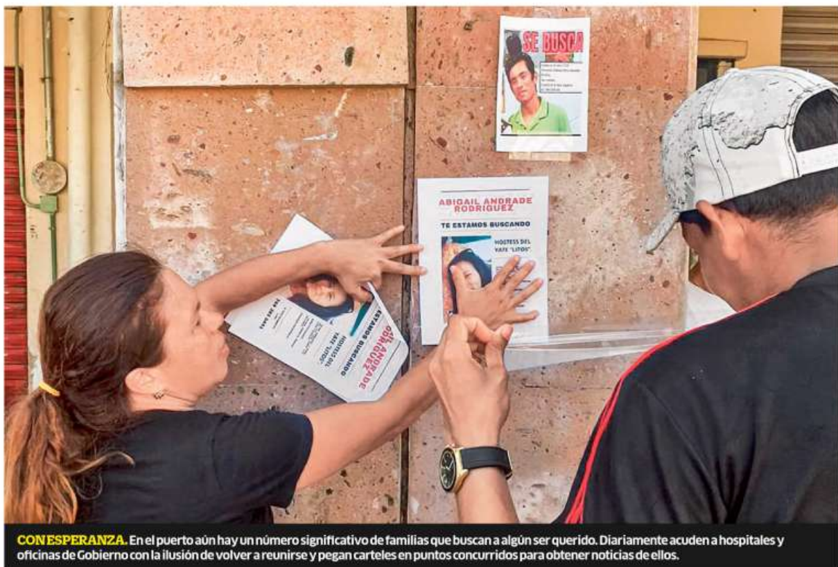
CONESPERANZA. En el puerto aún hay un número significativo de familias que buscan a algún ser querido. Diariamente acuden a hospitales y oficinas de Gobierno con la ilusión de volver a reunirse y pegan carteles en puntos concurridos para obtener noticias de ellos.