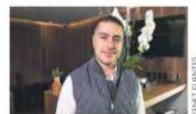
Unidad. Si no es elegido, ayudará.