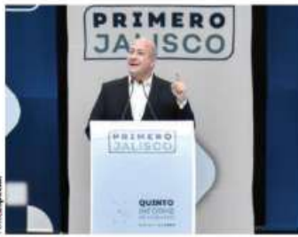
EL GOBERNADOR Enrique Alfaro, ayer.

"No vamos a fallar en los tiempos por venir": Alfaro