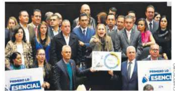
Arrancan discusión. Sin asignar recursos para reconstruir Acapulco