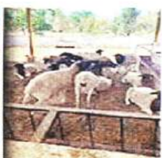
Ganado y lujos hallados en un rancho de Hidalgo que fue ligado al cartel inmobiliario de la Alcaldía Benito Juárez.