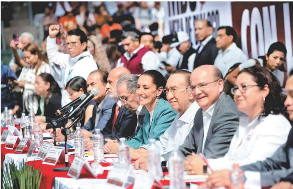
La aspirante se reunió en la Sala de Armas de la Magdalena Mixhuca con líderes gremiales de IMSS, Telmex, Metro y CROC.