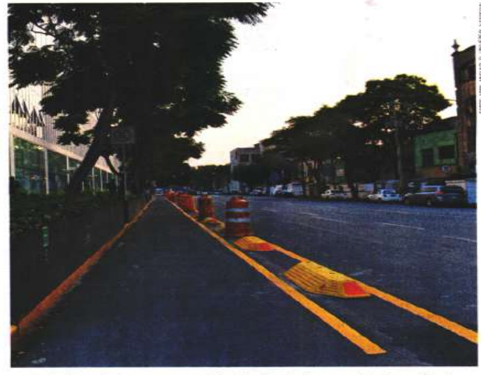
Las secretarías de Movilidad y de Obras del Gobierno capitalino, a través del Fonacipe, comenzaron la instalación de la nueva ciclovia confinada en Niños Héroes, en la alcaldía Cuauhtémoc, cuya inversión es de 3.5 millones de pesos. Irá de Dr. Río de la Loza a Dr. Balmis.