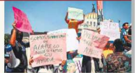
LES IMPIDIERON EL PASO AL ZÓCALO, ACUSAN LA CARAVANA CIUDADANA QUE SALIÓ EL DOMINGO DE ACAPULCO NO PUDO LLEGAR A PALACIO. PÁG. 31