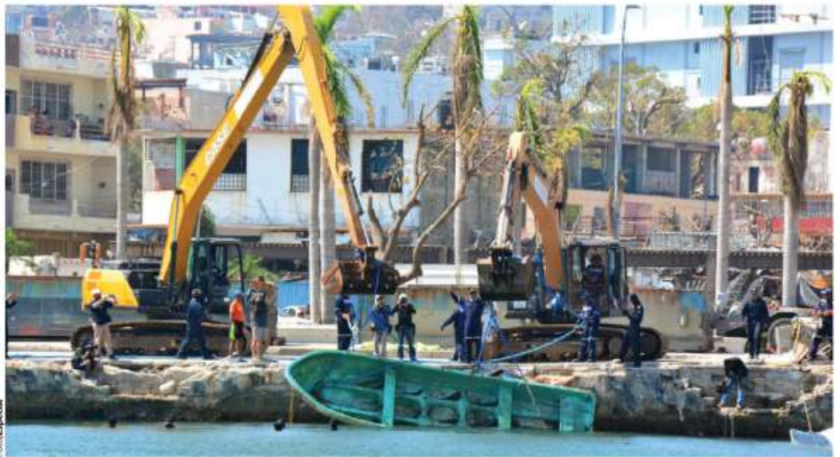
ELEMENTOS de la Marina recuperan ayer una lancha en el Malecón.

ACUERDA FRENTE QUE CANDIDATO A LA CDMX SALDRÁ DE UNA ENCUESTA