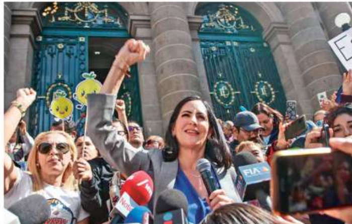
MANIOBRAS. Los diputados de Morena temen perder el Gobierno y por eso no otorgaron el primer permiso, consideró la alcaldesa

Refirió que recibió un mensaje del diri-