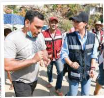
LA GOBERNADORA de Guerrero entregó ayer apoyos casa por casa.

AMLO acusa politiquería en caravana: ésta llega al Zócalo y ahí acampa; "Acapulco los necesita", dicen. págs. 5, 7, 8 y 17