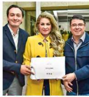
UNIDOS. Líderes estatales del PAN, PRD y PRI entregaron su convenio de coalición en el IECM.