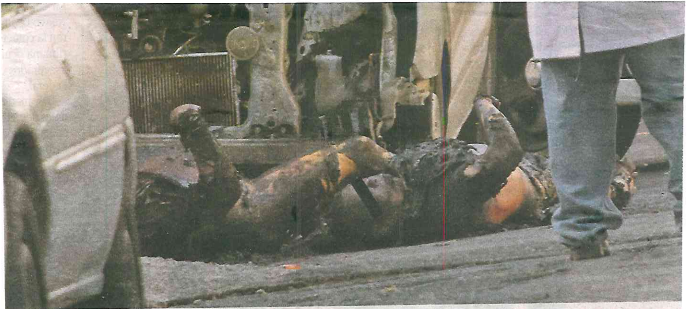
Personal forense reunió evidencias del crimen en busca de establecer la identidad de las víctimas

Por este doble homicidio la Fiscalía General de Justicia (FGJ) de la Ciudad de México inició la carpeta de investigación CI-FIEDH/2/UI-IC/D/00334/12-2020.