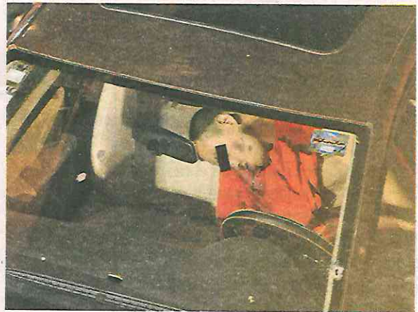
Los proyectiles atravesaron el parabrisas y la ventanilla y se incrustaron en el cuerpo del conductor

Debido a ello, el conductor del vehículo Vento se desvaneció mortalmente herido en el asiento delantero iz-