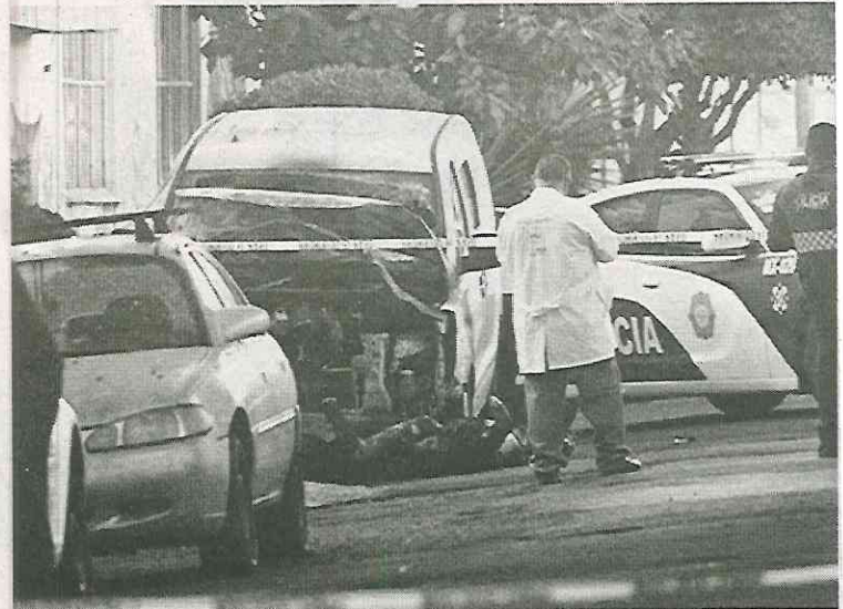
El espectáculo era dantesco

El caso se perfila como una venganza perpetrada por miembros del crimen organizado