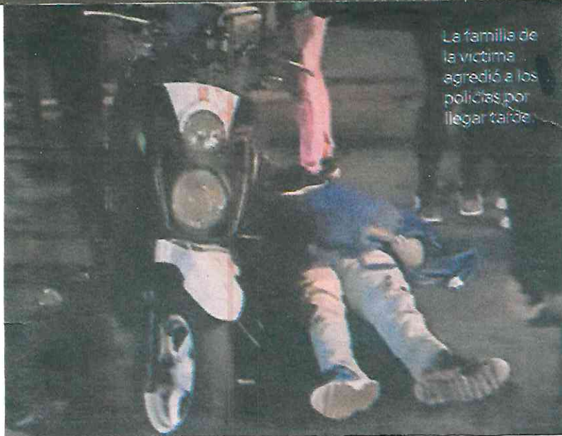
La familia de la víctima agredió a los policías por llegar tarde.

Aunque los vecinos de la zona se negaban a declarar, las autoridades informaron que el homicidio estaría relacionado con la venta de drogas en esa colonia.