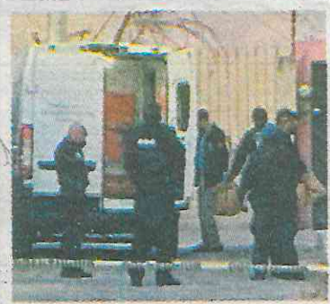
Ya se investigan los hechos

Dueña del inmueble asegura que las víctimas eran sus inquilinos