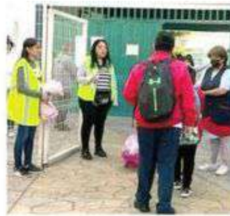
- Beneficia a 190 escuelas

Integrantes de la Policía Comando VC en coordinación con la Secretaría de Seguridad Ciudadana vigilarán el día de mañana la entrada y salida de los alumnos