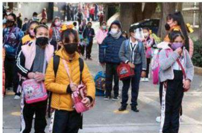
Hoy regresan a clases más de un millón setecientos mil alumnos en la CDMX.

El jefe de Gobierno de la Ciudad de México, Martí Batres, resaltó la magnitud de este operativo, y subrayó su compromiso con la seguridad y el bienestar de la comunidad escolar.