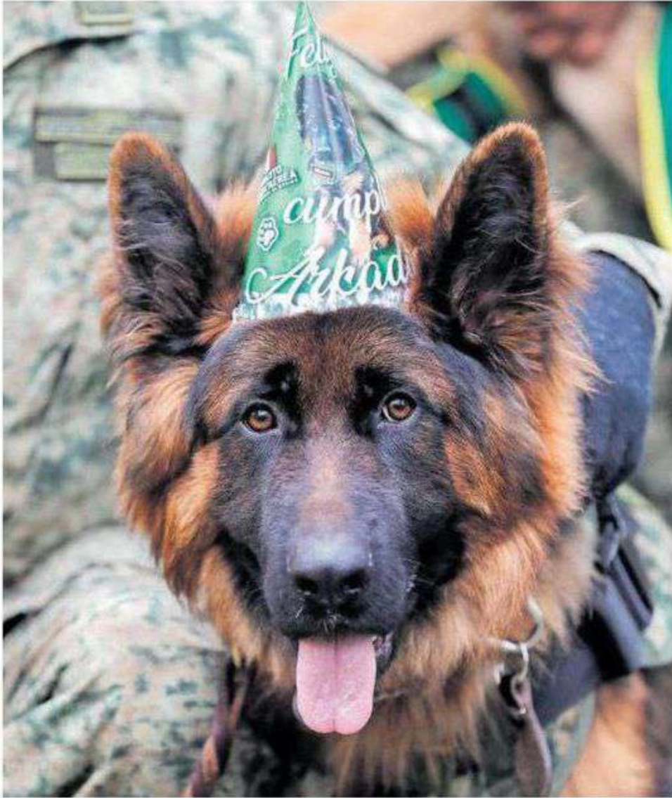
Ayer Arkadas celebró su primer cumpleaños con pastel, gorritos y perros invitados.