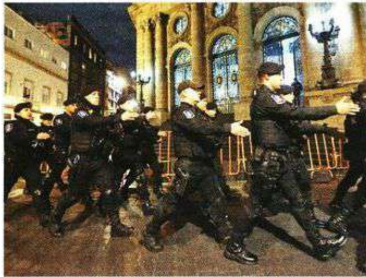
■ Elementos de la Policía de la Ciudad de México llegando al recinto de Donceles.