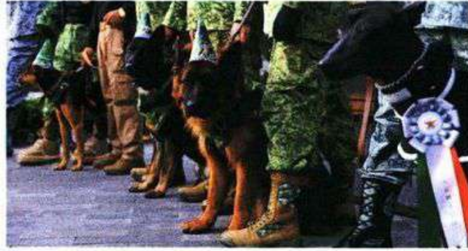
En el evento estuvieron el "sargento" Roko; Cadete, perrito adoptado por la SSC, y Dante, un xoloitzcuintle de la Guardia Nacional, entre otros.