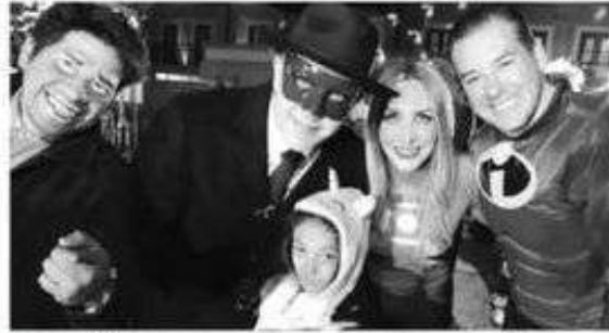
Es su último evento de este tipo como edil

Juguetes fueron adquiridos con recursos propios de los servidores públicos