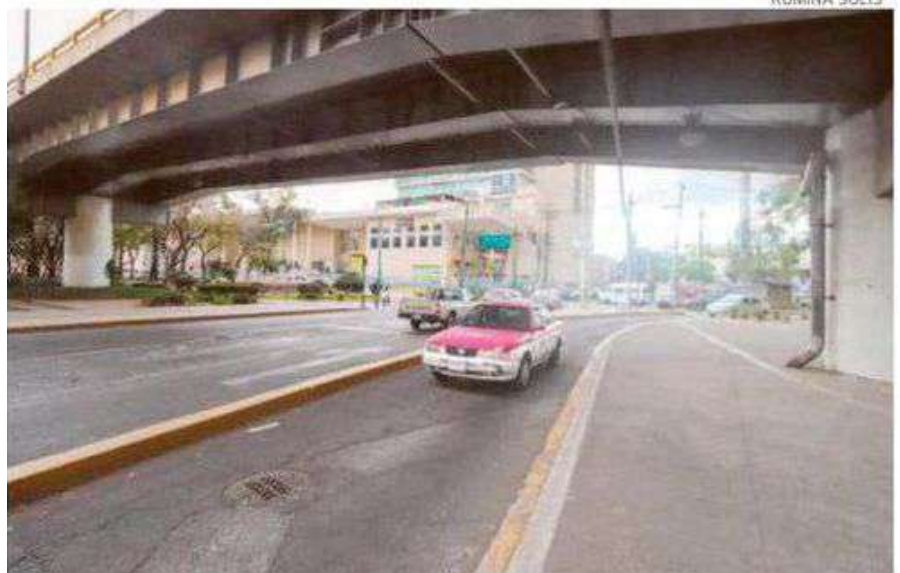
El reversible cruza las alcaldías de Iztapalapa, Iztacalco y Benito Juárez

LA POLICÍA destinará 53 agentes, siete patrullas, ocho motopatruillas y dos grúas para la nueva ruta