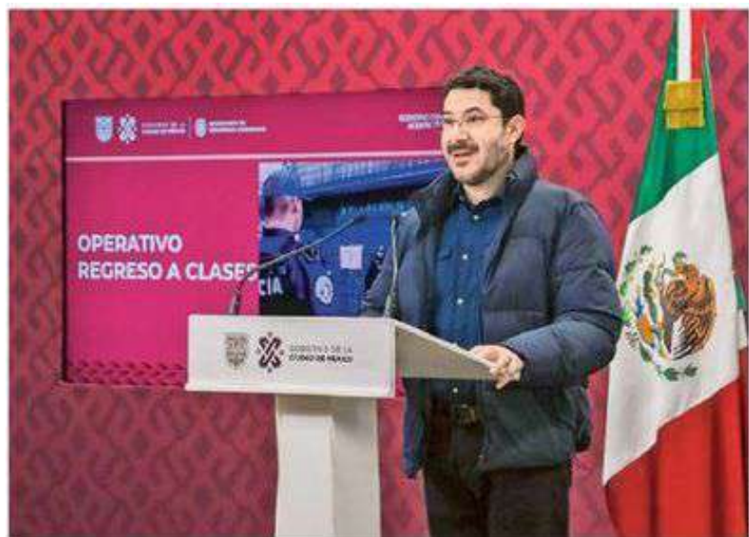
FUERZA. Martí Batres señaló que desde las 06:00 horas de hoy, los agentes realizarán recorridos de seguridad en planteles de las 16 alcaldías.

La ruta conecta las alcaldías Iztapalapa, Iztacalco y Benito Juárez, por lo que se habilitarán cuatro carriles reversibles en sentido Poniente a Oriente, mientras que el carril dedicado al transporte público operará de manera regular.