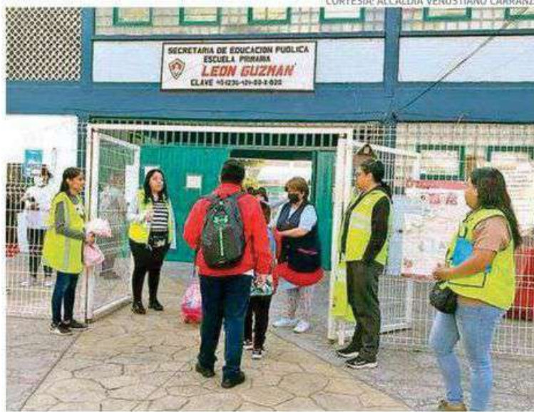
Ofrecen a los alumnos un retorno a las aulas con seguridad y tranquilidad