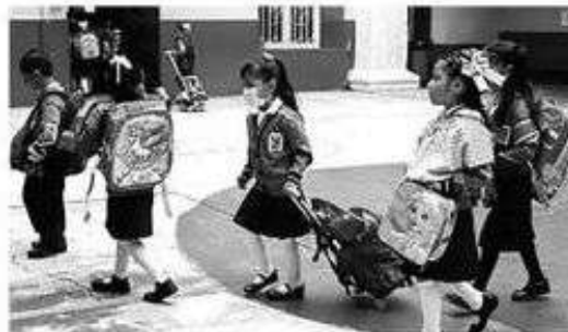
A cargo de 14 mil 588 elementos de la SSC

Buscan desahogar la acumulación que se hace en el Viaducto rumbo al oriente por la noche; por las obras que se están realizando en la Línea 9 del Metro