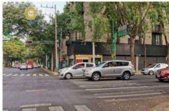
El tramo será reversible de lunes a viernes, en el horario de 18:00 a 21:00 horas

El objetivo primordial de esta medida es optimizar los tiempos de traslado de quienes se desplazan hacia el oriente de la ciudad. El nuevo esquema contará con señalización adecuada y material informativo para guiar a los conductores de manera efectiva. ● (Gerardo Mayoral)