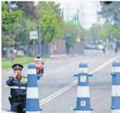
Multarán a los autos en Eje 5 Sur de no respetar el horario reversible.