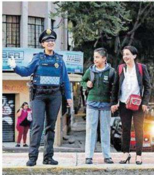
Elementos listos para resguardar la seguridad de los estudiantes.

Se dispondrá en las alcaldías 14 mil 588 efectivos -con mil 088 vehículos-