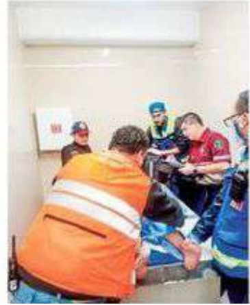
CAPACITADOS. En 2023 la Policía capitalina auxilió a 30 futuras madres y recibió a 21 bebés.

En tanto, a lo largo del 2023, efectivos de la SSC auxiliaron a 30 mujeres en labor de parto y asistieron a 21 de ellas para recibir a sus bebés.