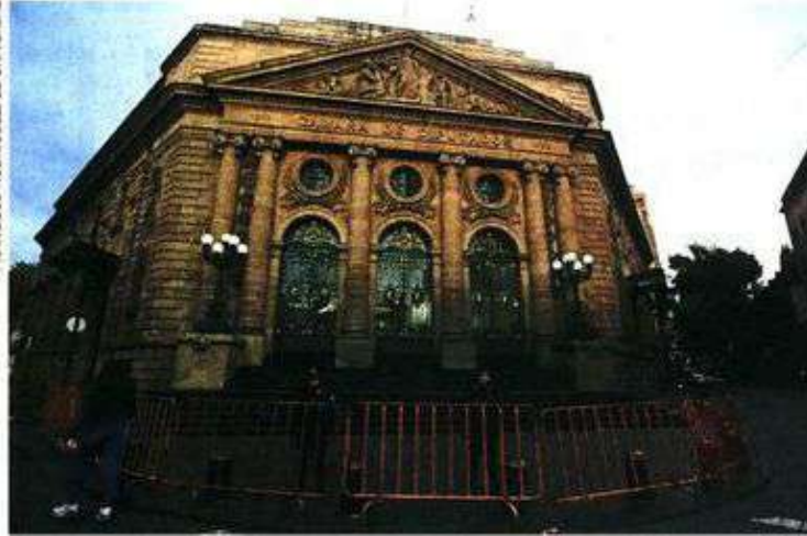
Desde la tarde del domingo, el Congreso de la Ciudad de México fue cercado con vallas metálicas.