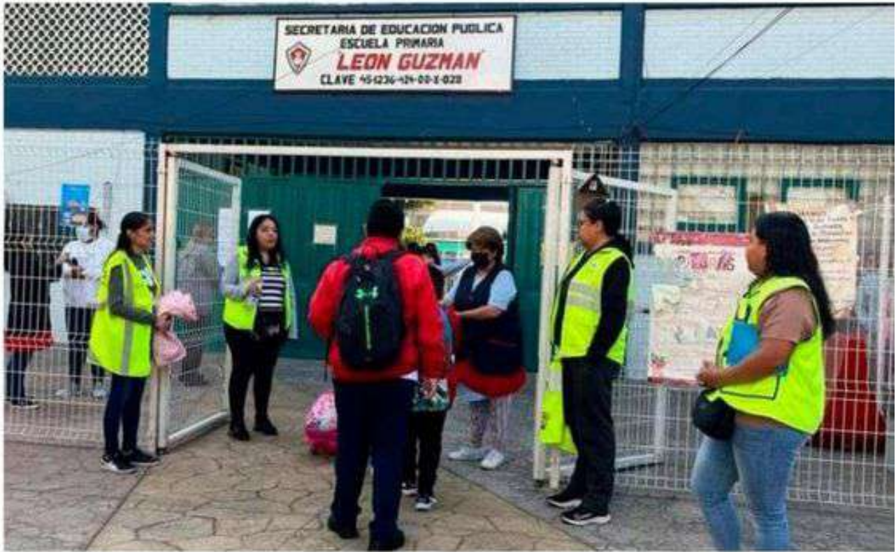
La alcaldía Venustiano Carranza implementa un dispositivo de seguridad en sus más de 190 escuelas públicas de educación básica y bachillerato.