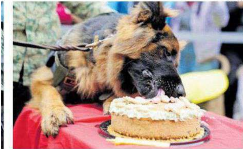
La tradicional mordida al pastel.