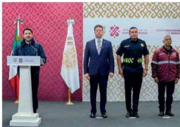
En la CDMX se trabaja de manera coordinada para asegurar la protección y bienestar de niñas, niños, adolescentes y sus familias.

participarán en este operativo que abarca las 16 alcaldías de la Ciudad de México