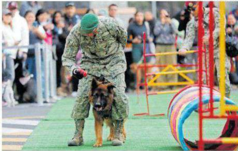
Tras su adiestramiento, se integrará a labores de revisión en aeropuertos.