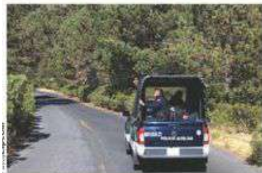
ELEMENTOS del orden realizaron en días pasados patrullajes en la zona ecológica.