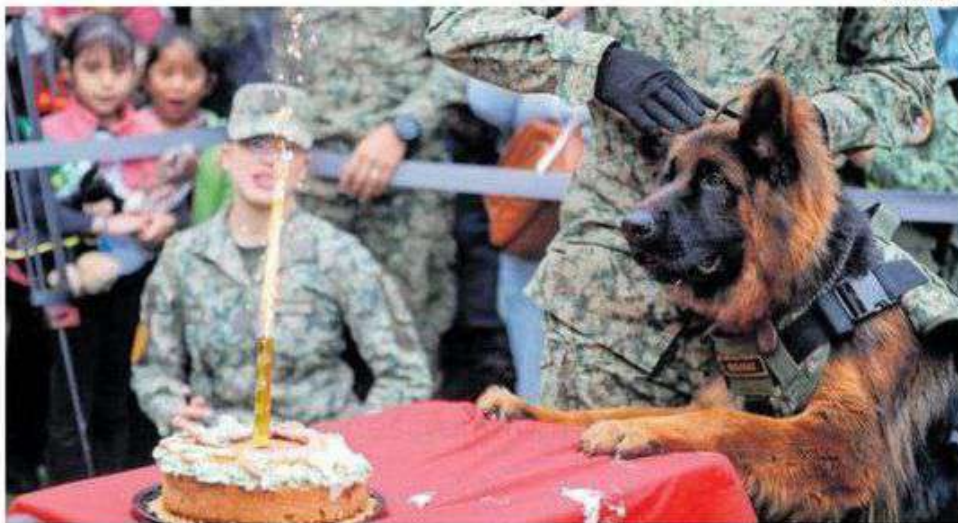
Arkadas emocionado veía la vela de su pastel, mientras le cantaban Las Mañanitas.