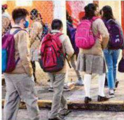
Hoy regresan más de un millón