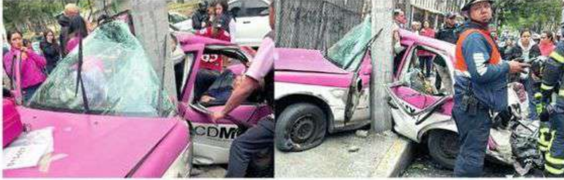
La suerte estaba de su lado, pues salieron vivos y coleando