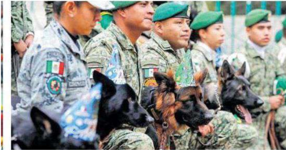
Los invitados atentos durante las mañanitas del cumpleaños.*