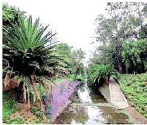
Han aparecido cuerpos flotando

Hay grupos de personas que acuden a este lugar para tirar basura, contaminar las aguas con residuos, entre otros materiales