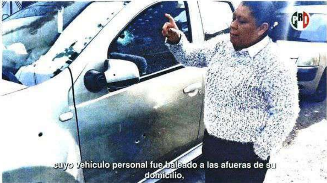
cuyo vehículo personal fue baleado a las afueras de su domicilio,

La diputada priísta Guadalupe Barrón denunció que este 7 de enero su vehículo fue baleado afuera de su domicilio y que, además, recibió amenazas y mensajes intimidatorios.