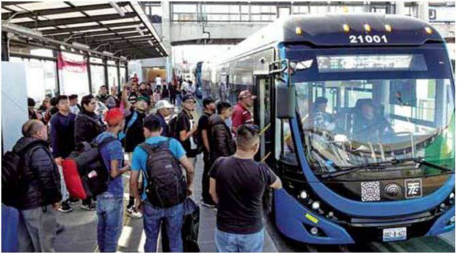
Vialidad. El cambio a los carriles de Eje 5 Sur se realiza para disminuir la presión ocasionada por las obras en la Línea 9 del Metro.