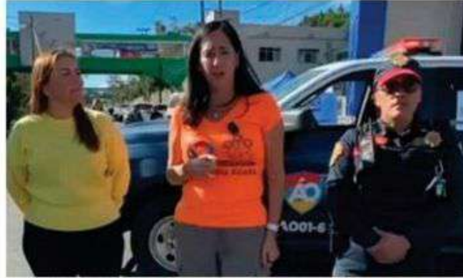
La alcaldesa Limón destacó acciones adicionales implementadas durante el ciclo escolar, que incluyen patrullajes itinerantes en escuelas.

Estas iniciativas buscan fomentar la sana convivencia escolar y prevenir el consumo de sustancias prohibidas en los alrededores. La alcaldesa Limón desea un feliz regreso a clases para los poco más de 180 mil estudiantes de los niveles preescolar, primaria, secundaria y bachillerato. • (Redacción / Crónica)