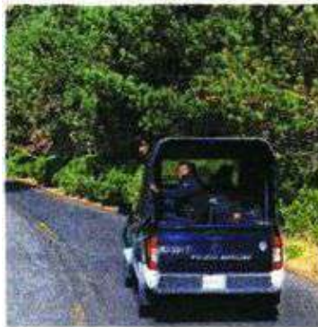
La tala ilegal ha afectado casi 300 hectáreas en el Ajusco y Topilejo.

La estrategia incluirá el despliegue colaborativo de la Guardia Nacional, Ejército, Profepa y la Comisión de Recursos Naturales y Desarrollo Rural. Se instalarán bases y campamentos de vigilancia en diversos puntos como Parres y La Placa. ●