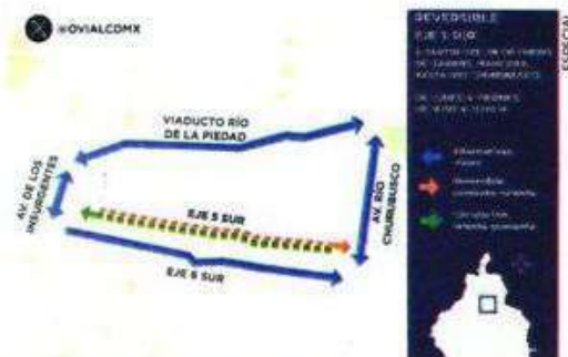
Eje 5 Sur actúa como apoyo al flujo de regreso a la zona oriente y ayuda al Viaducto, indicó el subsecretario.

de Eje 4 Oriente a Eje 2 Poniente, serán reversibles de 18:00 a 21:00 horas.