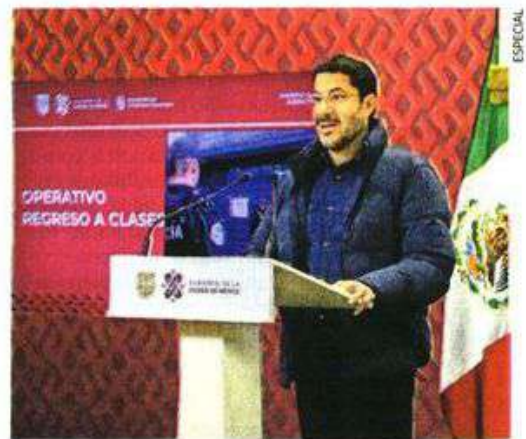
El operativo de regreso a clases iniciará a las 6:00 horas, precisó el jefe de Gobierno, Martí Batres.

participarán este lunes vigilando calles de las 16 alcaldías; también habrá 41 motocicletas, y cinco grúas.