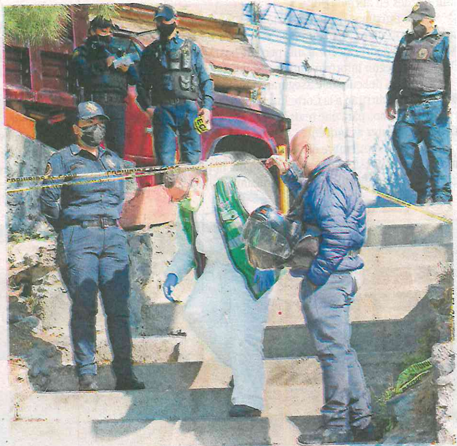
Uniformados en el sitio del crimen

Uniformados arribaron al sitio donde hallaron al hombre tirado en la banqueta sobre un charco de sangre con varias le-