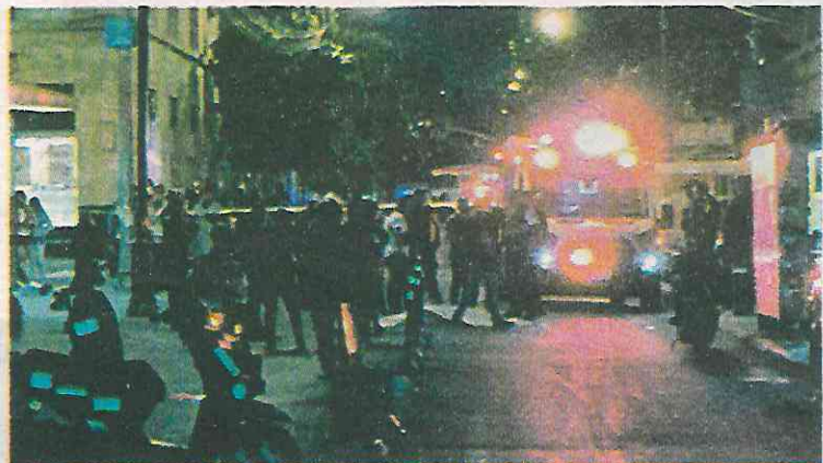
La muerte se les cruzó en el camino

En lo que va del fin de semana han muerto 5 motociclistas, 2 en Ecatepec; uno en Tultepec; otro en Venustiano Carranza y uno más en la alcaldía Cuauhtémoc