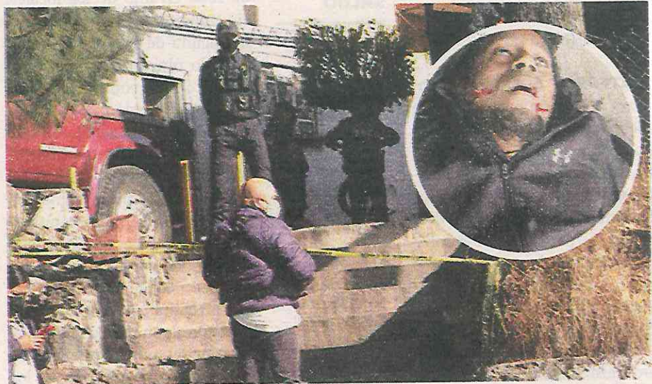
Se trató de un ataque directo

La víctima, de aproximadamente 45 años de edad, quedó tirado sobre la calle Peruanos, tras recibir tres impactos de arma de fuego en una pierna, tórax y en la cara, por lo que el lugar fue acordonado y resguardado por policías preventivos mientras arribaban los servicios periciales para realizar el levantamiento del cadá-