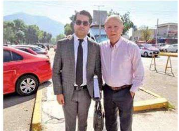
Ciro Gómez Leyva acudió al Reclusorio Norte y en su noticiario dio detalles de sus presuntos agresores.