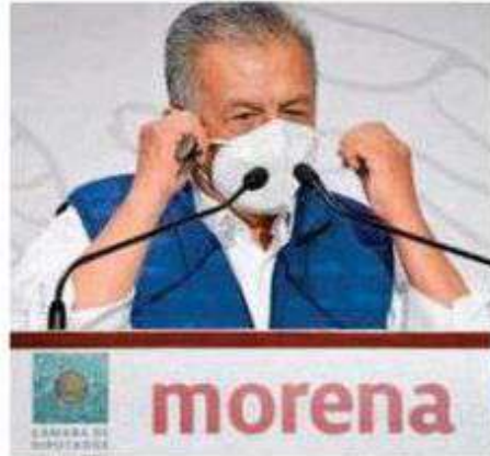
En 2021 fue desaforado por la Cámara de Diputados

En otro hecho, en el año 2019, el acusado habría violentado sexualmente a la segunda víctima de entonces 16 años de edad, a quien supuestamente apoyaría con una beca para estudiar.