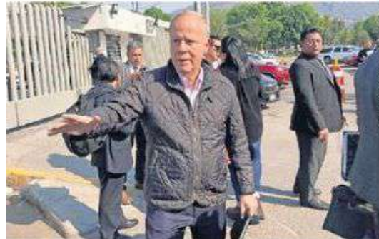
El periodista Ciro Gómez Leyva agradeció a la FGR por el trabajo realizado para detener a sus presuntos atacantes.

El procedimiento abreviado es una forma de terminación anticipada del proceso, prevista en el Código Nacional de Procedimientos Penales artículo 201, el cual simplifica la resolución del proceso por medio de la negociación de la acusación con el imputado-acusado. ●