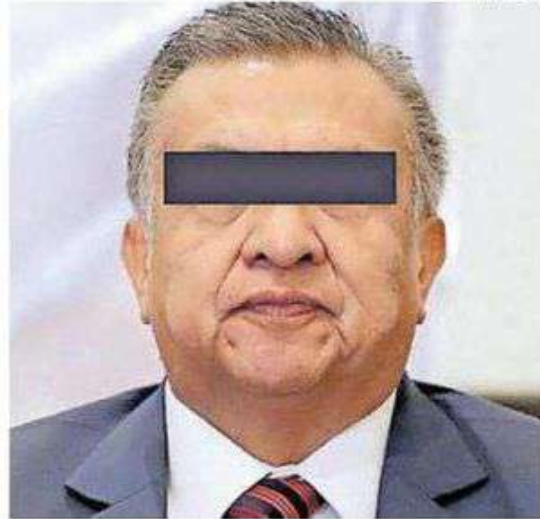
El fuero no ayudó al político poblanco

El 18 de febrero de 2022, la Fiscalía General del Estado de Puebla (FGE) informó la vinculación a proceso del exdiputado por otros dos casos de abuso sexual, por lo cual se le mantuvo en el Reclusorio Oriente de la Ciudad de México.