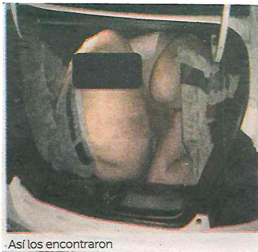
Así los encontraron

De acuerdo a las pesquisas, el músico asesinado era expareja de una sobrina de El Ojos , extinto líder de El Cártel de Tláhuac .