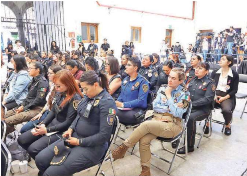
Mujeres policías tomaron cursos para dar atención a cualquier eventualidad durante la marcha de hoy

Al preguntarle cuál es la importancia de que las mujeres estén en puestos claves, la mandataria afirmó que la participación de la mujer enriquece la democracia en México.