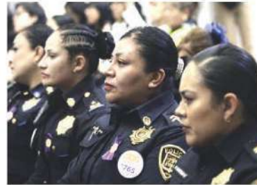
La Ssecretaria de Mujeres estará presente en mencionado evento. Especial

Debido a que se han indicado varios puntos de reunión, pero el principal es el Monumento a la Revolución, donde la cita es a las 16:00 para dar inicio. ●