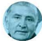
ADÁN AUGUSTO LÓPEZ

» Mucha confianza tiene la 4T en que el caso del crimen contra cuatro estadounidenses en Matamoros no afectará la relación bilateral. El titular de la Segob, Adán Augusto López , sostuvo que "es un incidente lamentable, pero no tiene por qué fracturar las relaciones de amistad, comerciales, económicas, con los Estados Unidos". Además, hay coordinación.