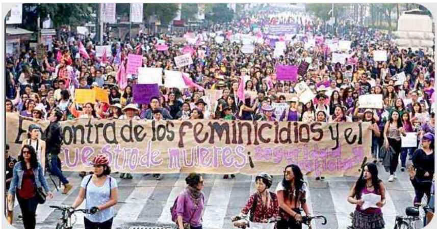
Alrededor del mundo se realizan marchas para conmemorar la lucha de las mujeres por la igualdad