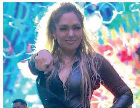
La intérprete está tranquila