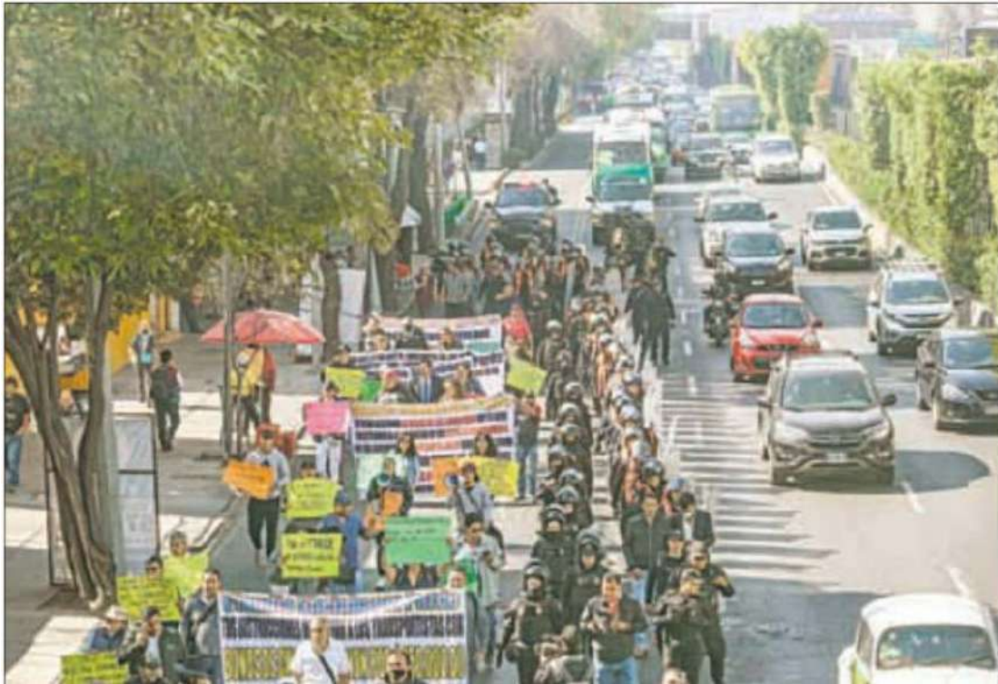
▲ Los conductores fueron encapsulados por policías capitalinos cuando marchaban sobre Tlalpan y San Antonio Abad.