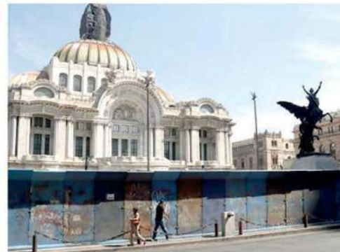
Llamam a que la manifestación sea pacífica

Usan vallas como parte del dispositivo de seguridad