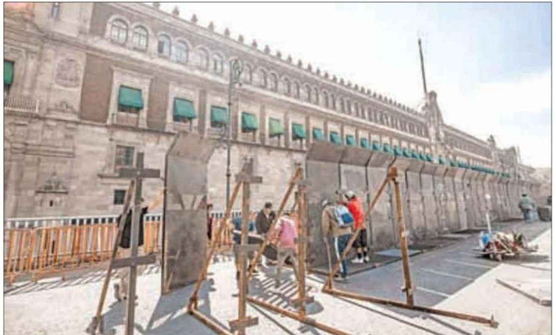
▲ Resguardo del Palacio Nacional ante las marchas.