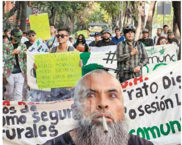
Consumidores de mariguana marcharon al Senado