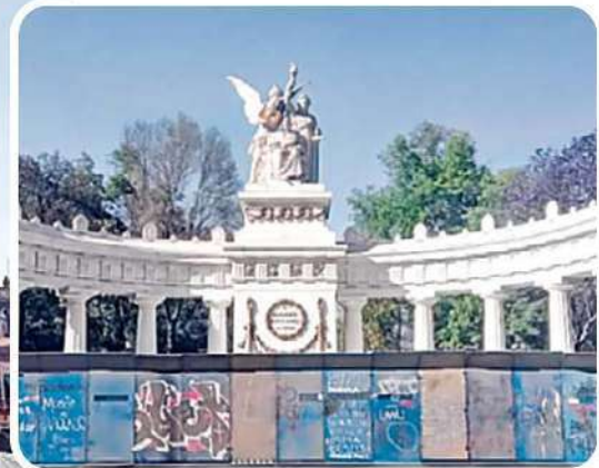
PREPARADOS. Monumentos como el Hemiciclo a Juárez y el Palacio Nacional ya se encuentran resguardados por las vallas azules.