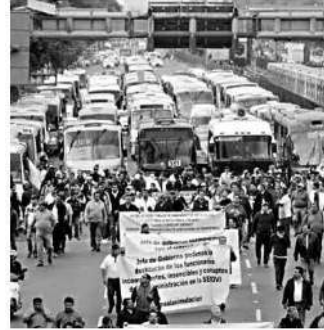
· Los han marginado

Al respecto, la Secretaría de Movilidad de la Ciudad de México (Semovi) puntualizó que se han realizado mesas de diálogo entre la dependencia y los manifestantes, pero que, aclaró, la protesta responde al “descontento de un grupo minoritario”.