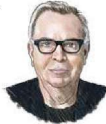
David Alan Chipperfield

Premio Pritzker 2023, considerado el "Premio Nobel de la Arquitectura". El británico ha sido también el diseñador de obras como el Neues Museum de Berlín, Alemania, o el Museo de Historia Natural de Zhejiang en China. Tiene una historia particular con nuestro país, donde ya había sido reconocido con el Premio Obras Cemex 2014 en las categorías de Edificación Educativa y Cultural y en la Institucional-Industrial Internacional, justamente por el uso de materiales de la cementera que