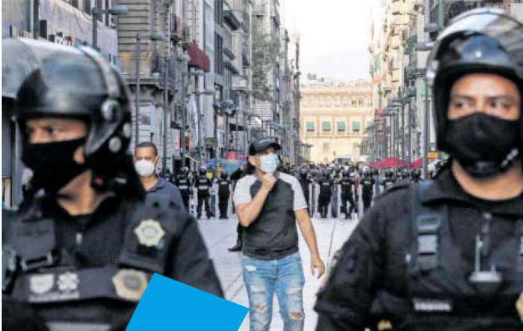
Los cuerpos policíacos están listos.