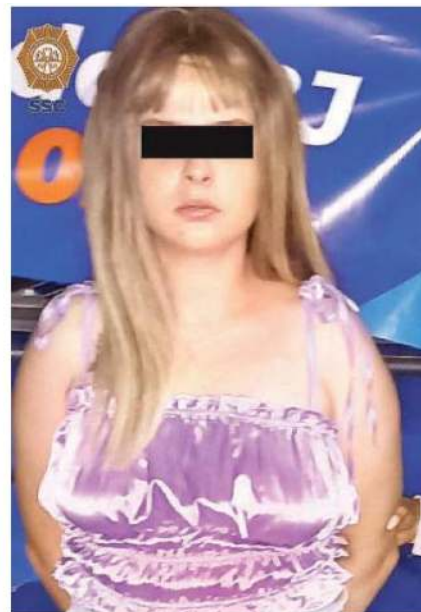
La mujer de 20 años, quien se encontraba en aparente estado de ebriedad

Por tal motivo, la mujer de 20 años de edad, quien se encontraba en aparente estado de ebriedad, fue detenida y a petición de las denunciantes la trasladaron, junto con las pertenencias recuperadas, ante el agente del Ministerio Público, quien se encargará de definir su situación jurídica; antes le comunicaron sus derechos de ley.