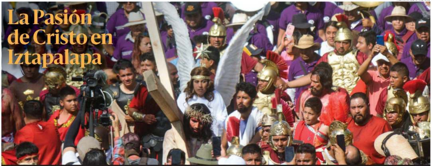
Con un fuerte dispositivo de seguridad en el centro de la alcaldía Iztapalapa se realizó la representación 180 de la Pasión de Cristo que comenzó con la procesión de los nazarenos por los ocho Barrios de la alcaldía. Participaron 1,100 policías y cientos de actores, luego de las restricciones por la pandemia COVID19. PAG 10