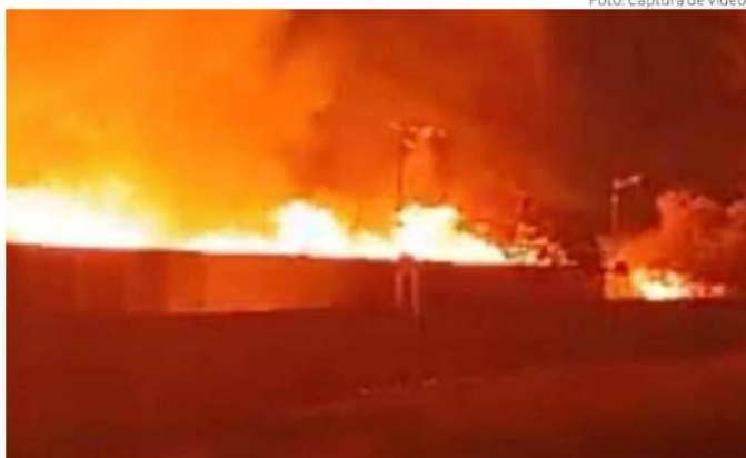
Incendio en el área federal de la Central de Abasto, en Iztapalapa.

Para atender a los comerciantes afectados se creó una comisión representativa para darle seguimiento a los acuerdos y facilitar su reinstalación.