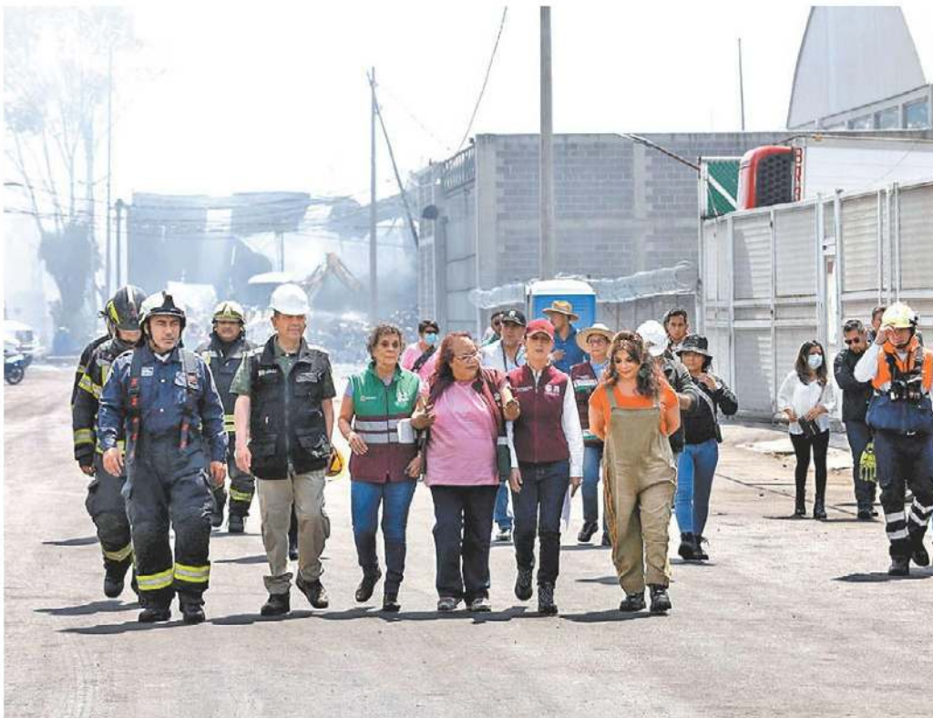
La jefa de Gobierno encabezó un recorrido por la zona siniestrada. OCTAVIO HOYOS