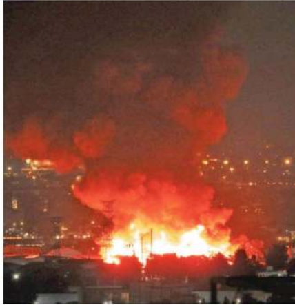
las llamas comenzaron a propagarse con prontitud al interior del inmueble, alcanzando espacios aledaños