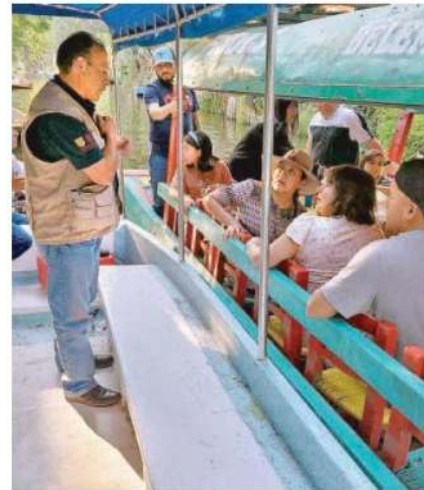
Hay dispositivo especial en embarcaderos ante la gran afluencia

INHIBIR EL consumo excesivo de alcohol y evitar abusos en tarifas, son los objetivos del dispositivo especial; sancionarán a quienes desperdicien agua hoy Sábado de Gloria