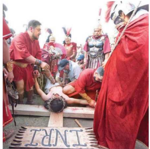
Cada uno de los pasajes bíblicos fueron representados por habitantes de esta demarcación

Para este Viernes Santo participaron 2 mil 553 elementos de diferentes corporaciones policiales, 370 vehículos de patrullaje, 14 grúas y un equipo táctico móvil