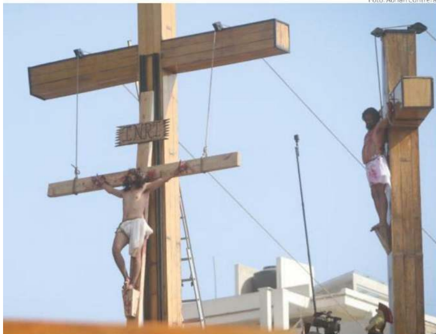
Familias, autoridades y comités del barrio unen su devoción y tradiciones para llevar a cabo la encarnación del evento más importante de la religión católica.