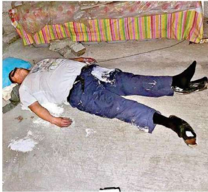
El hombre quedó sobre el suelo boca arriba, junto a la cubeta de pintura y el rodillo

Personal forense de la Fiscalía General de Justicia a su llegada realizó las diligencias necesarias y el levantamiento del cuerpo, el cual salió del domicilio dentro de la bolsa blanca.