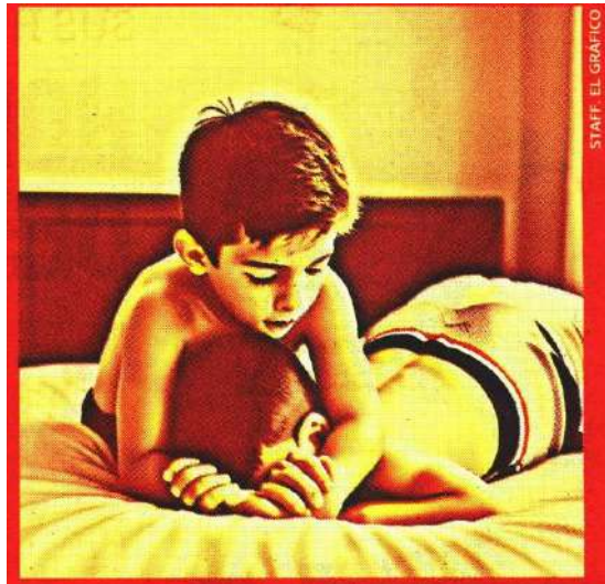
STAFF. EL GRÁFICO

Luchadores recomiendan a los niños que no practiquen sus movimientos sin preparación profesional.