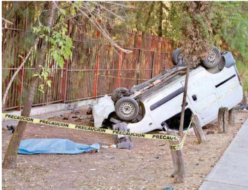
Un hombre murió al volcar su camioneta en Oceanía; en el accidente, su acompañante resultó lesionada; peritos en mecánica y vialidad determinarán las causas del siniestro