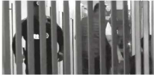
Gran movilización de la policía

Autoridades ya indagan los hechos, pues, hasta el momento el motivo del ataque sigue siendo un misterio