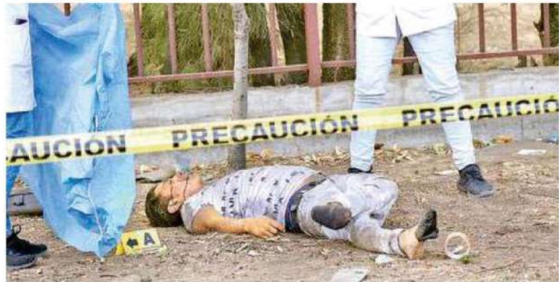
La tragedia se registró minutos después de las cuatro de la mañana, donde el conductor falleció; en las diligencias se hallaron latas de cerveza

El vehículo chocó contra un poste y una señalización los cuales derribó, para después de lado del conductor impactar contra otro de concreto, lo cual hizo que volcara