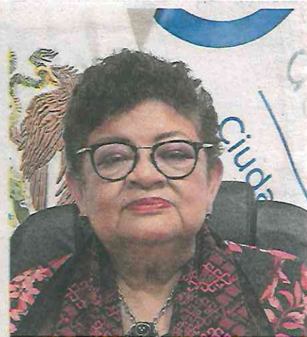
Ernestina Godoy, Fiscal General de Justicia de la Ciudad de México