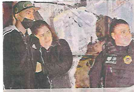
■ De acuerdo con los primeros reportes, se trató de un asalto.