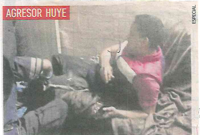
La víctima sufrió fractura en tibia y peroné por el balazo.