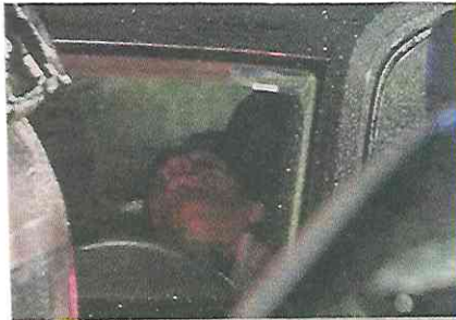
■ El automovilista fue asesinado frente al Motel Éxtasis, en Iztacalco.

Dos familiares de la víctima llegaron al sitio para identificar el cuerpo que fue sacado del automóvil hasta que arribaron peritos a las 22:30 horas.