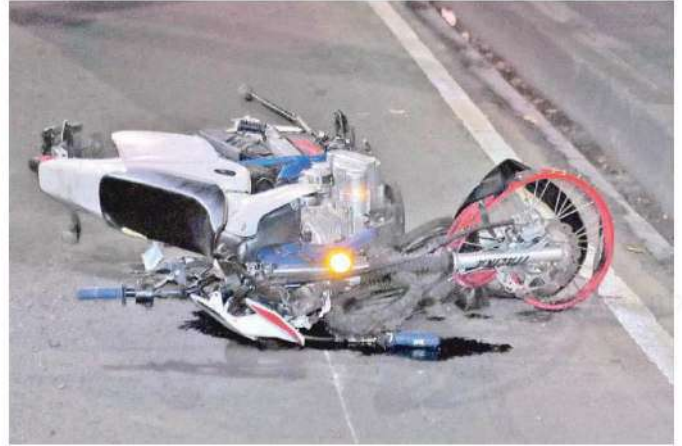
Fue poco antes de las 5:00 horas, cuando ocurrió el siniestro, del que se percataron automovilistas al circular por la zona

A consecuencia del fuerte impacto, el biker salió proyectado y debido a las heridas y fracturas que sufrió tuvo una muerte instantánea