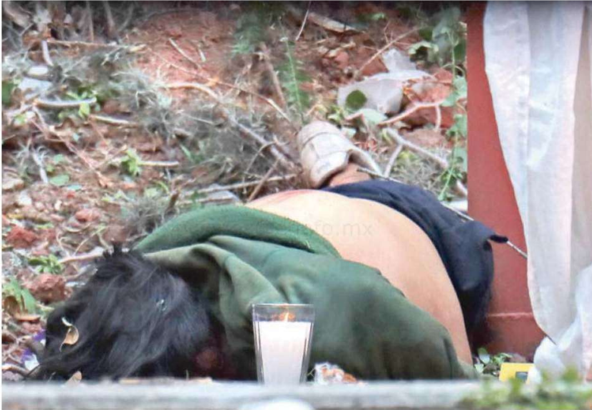
La espalda de la víctima mostraba golpes y rasguños