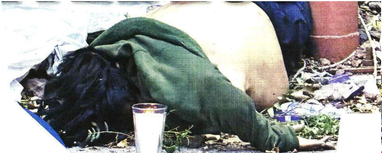
MUJER CAYÓ DE UNOS 30 METROS

MUJER CAYÓ DE LO ALTO DEL PEÑON VIEJO; QUEDÓ TIRADA EN UNA UNIDAD. PÁG. 6