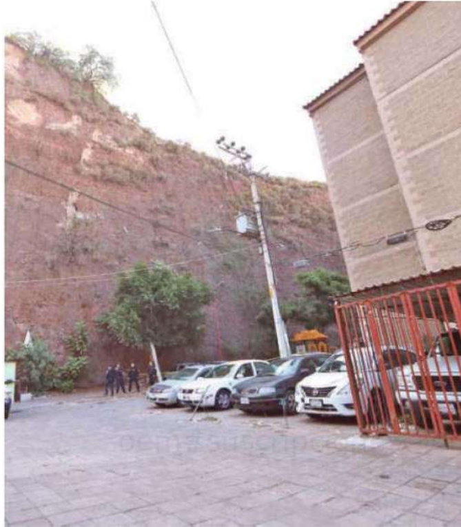
Los vecinos dicen, que probablemente se trató de una caída del cerro