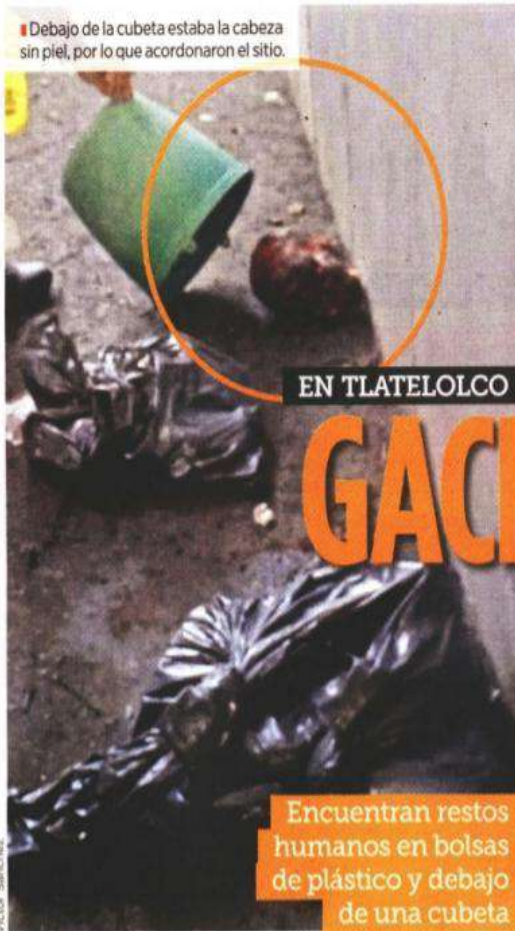
■ Debajo de la cubeta estaba la cabeza sin piel, por lo que acordonaron el sitio.