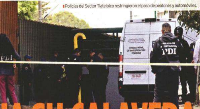
■ Policías del Sector Tlatelolco restringieron el paso de peatones y automóviles.