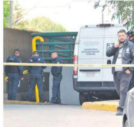
Los vecinos reportaron las bolsas