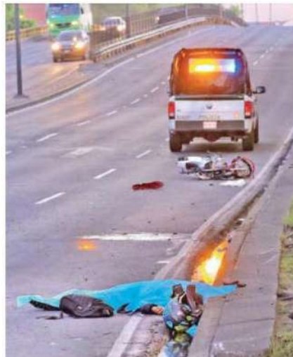
El cadáver fue trasladado al anfiteatro de la demarcación

A consecuencia del fuerte impacto, el biker salió proyectado y debido a las heridas y fracturas que sufrió tuvo una muerte instantánea