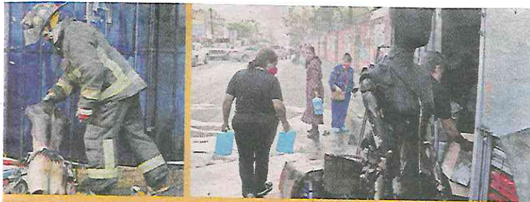
Las llamas alcanzaron seis puestos de comida, papelería y bodegas.