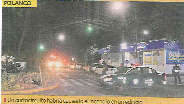
Un cortocircuito habría causado el incendio en un edificio.