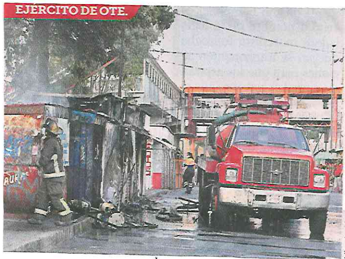
EJERCITO DE OTE.

Los bomberos tuvieron un día movido con conatos de incendios, uno en puestos semifijos junto a la FES Zaragoza y otro en un edificio de oficinas en la Calle Homero. Andrea Ahedo