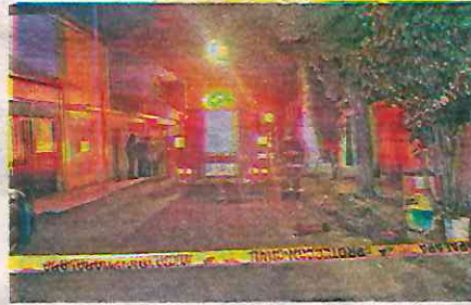
Elementos del H. Cuerpo de Bombero extinguieron el incendio

Los vecinos que despertaron por los ruidos y estruendos provocados por el incendio, así como por el olor a quemado de