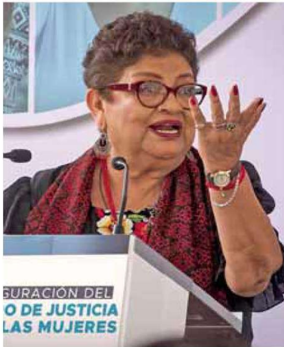
Debate. La eficacia de la FGJ está siendo cuestionada debido a la falta de avance en los casos.