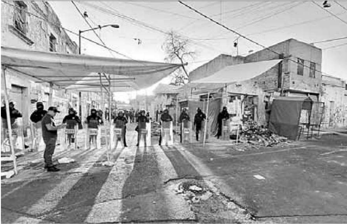
▲ El operativo estuvo respaldado por policías antimotines del agrupamiento Guerreros.