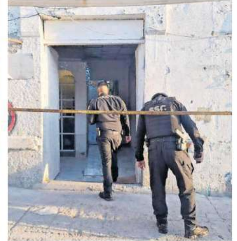
No se tiene reporte de personas detenidas, aunque ante la presunta comisión de un delito, los agentes aseguraron el predio colocando sellos en la puerta