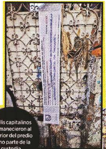
Polis capitalinos permanecieron al exterior del predio como parte de la custodia.

Durante las diligencias no hubo personas detenidas ya que el predio está deshabitado y solo es usado por gente en condición de calle.