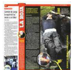
El velador perdió parte del dedo anular.