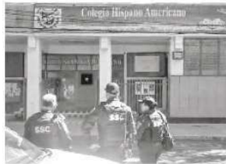
La policía revisó el plantel

Algunos padres de familia atravesaron una crisis nerviosa al preocuparse por el estado de sus hijos