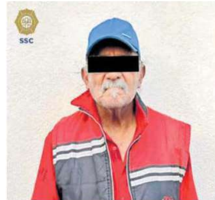
El hombre , de 69 años de edad, fue puesto a disposición del MP, que definirá su situación legal

Por lo anterior, el hombre de 69 años de edad fue detenido, informado de sus derechos de ley y junto con lo asegurado, fue puesto a disposición del agente del Ministerio Público correspondiente, quien definirá su situación legal e integrará la carpeta de investigación del caso.