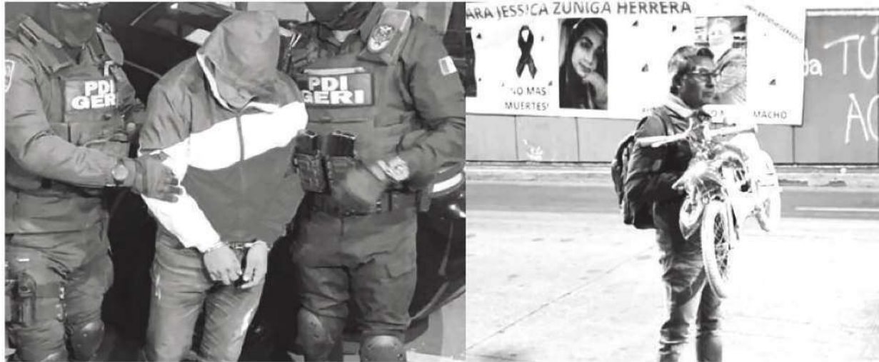
Mala actuación del Ministerio Público permitió su libertad