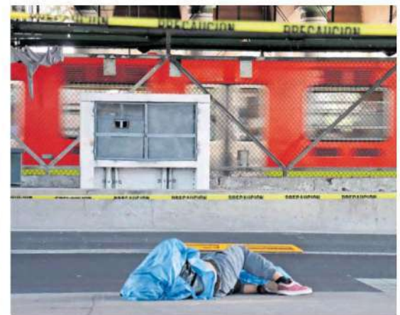
El cuerpo del hombre quedó tendido en el pavimento, bajo resguardo de los uniformados, quienes custodiaron el área hasta la llegada de los peritos