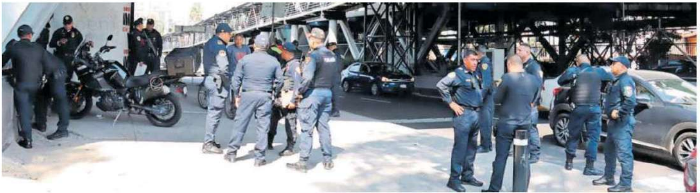
El afectado refirió que el asaltante lo despojó de su bolsa, celular, tarjetas bancarias, 2 mil pesos en efectivo y su celular con un valor de seis mil pesos en uno de los accesos al Metro