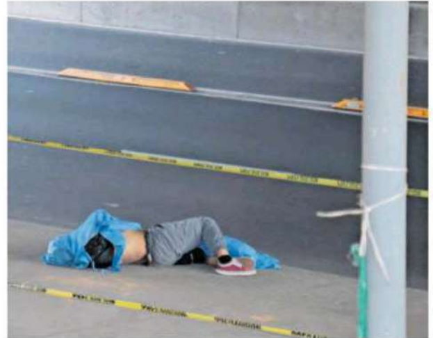
Autoridades continuarán con las investigaciones a fin de establecer los motivos por los que murió este presunto ladrón