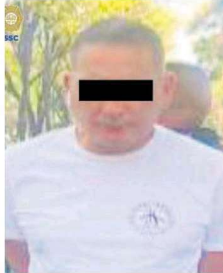
El imputado , de 39 años de edad, fue presentado ante el MP

Al hombre le efectuaron una revisión preventiva, tras la cual le hallaron 11 tarjetas bancarias de diferentes sucursales y con distintos nombres, las cuales no pudo comprobar la legal propiedad