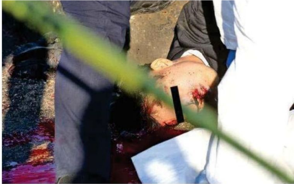
El fuerte golpe provocó que el motociclista saliera proyectado varios metros, quedando tendido sobre la cinta asfáltica