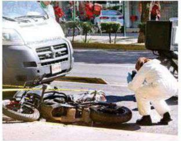
El accidente ocurrió minutos antes de las 14:00 horas de este lunes cuando transitaba sobre Municipio Libre