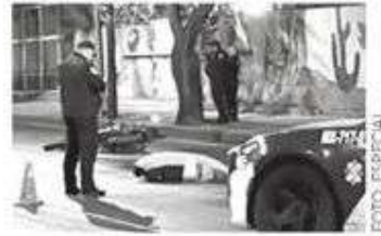
No la libró el biker

El motociclista herido fue trasladado por paramédicos al nosocomio más cercano, para recibir atención médica especializada.