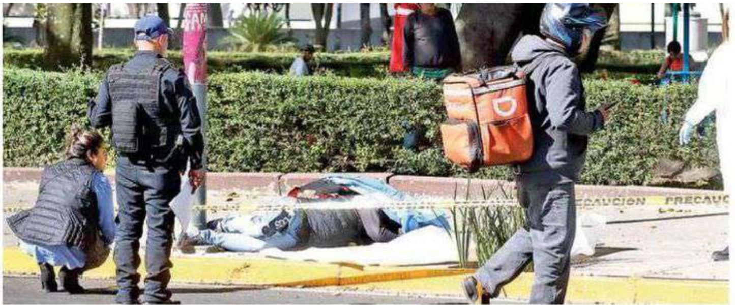
El biker salió proyectado del potro de metal y quedó tirado sobre la banqueta