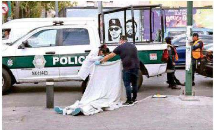
Muere un adulto mayor de un ataque fulminante al corazón en calles de la colonia Doctores

momento se desconoce su identidad quedó a resguardo de uniformados hasta el arribo de servicios periciales, quienes tras concluir las diligencias hicieron el levantamiento del cuerpo para trasladarlo a la coordinación territorial correspondiente donde se espera que familiares acudan a reconocerlo.