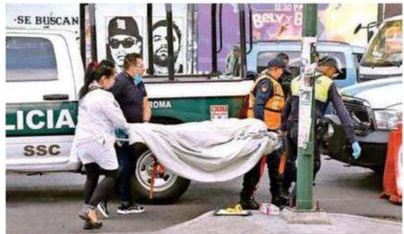
Trasladan el cuerpo a la coordinación territorial correspondiente, donde se espera que familiares acudan a reconocerlo