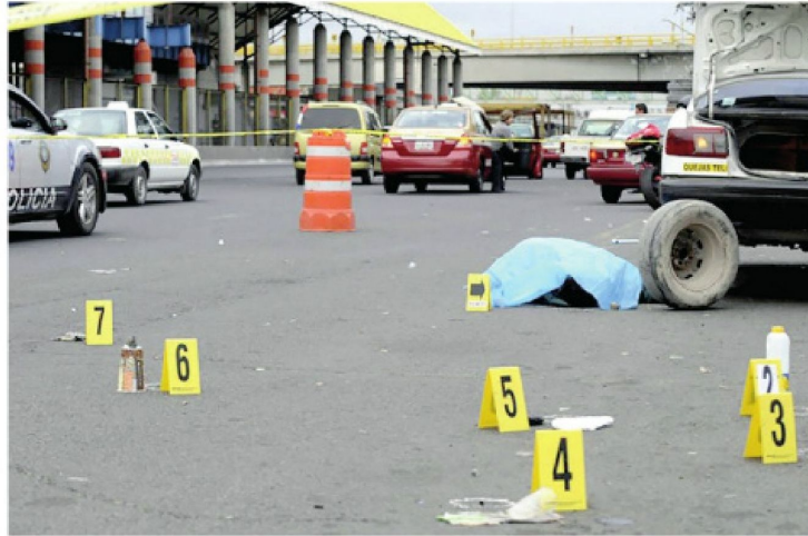
Los ilícitos no cesan en la capital del país