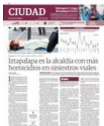
CUERPO Y CASCO de un motociclista arrollado por un auto en la alcaldía Iztapalapa, en 2024.