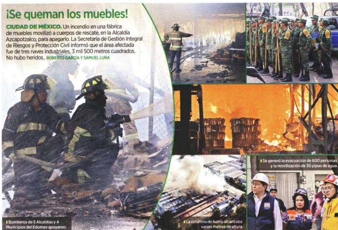
■ Bomberos de 5 Alcaldías y 4 Municipios del Edomex apoyaron.

CIUDAD DE MÉXICO. Un incendio en una fábrica de muebles movilizó a cuerpos de rescate, en la Alcaldía Azcapotzalco, para apagarlo. La Secretaría de Gestión Integral de Riesgos y Protección Civil informó que el área afectada fue de tres naves industriales, 3 mil 500 metros cuadrados. No hubo heridos. ROBERTO GARCÍA Y SAMUEL LUNA