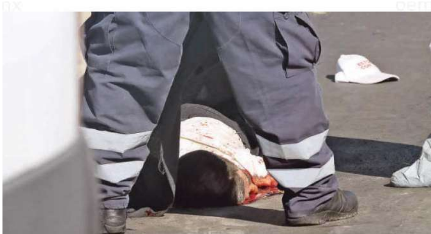
El hombre de la tercera edad regresaba junto con otras personas de una peregrinación a la Basílica de Guadalupe