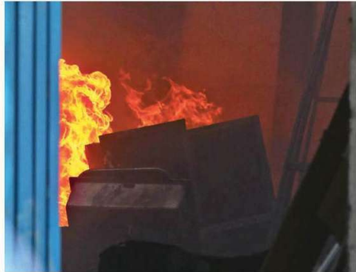
Alrededor de las 15:00 horas de este miércoles, las llamas comenzaron a consumir el interior del inmueble