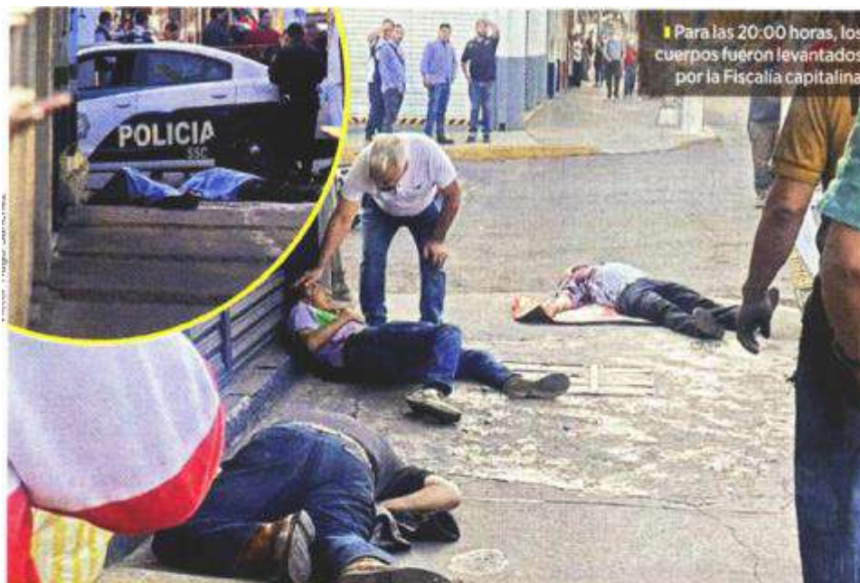
Para las 20:00 horas, los cuerpos fueron levantados por la Fiscalía capitalina.