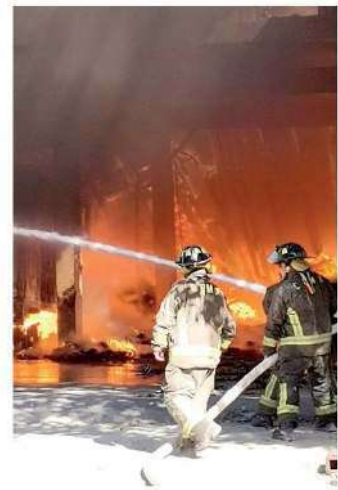
Bomberos sofocaron el fuego

los peritajes para establecer las causas del siniestro