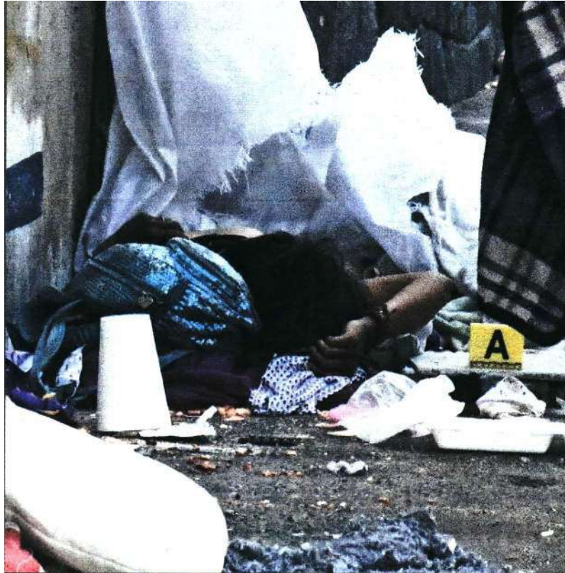
La víctima pernoctaba sobre la banqueta de Avenida Ferrocarril de Cintura.