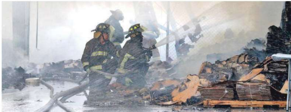
Integrantes del Cuerpo de Bomberos, acudieron a atender la emergencia