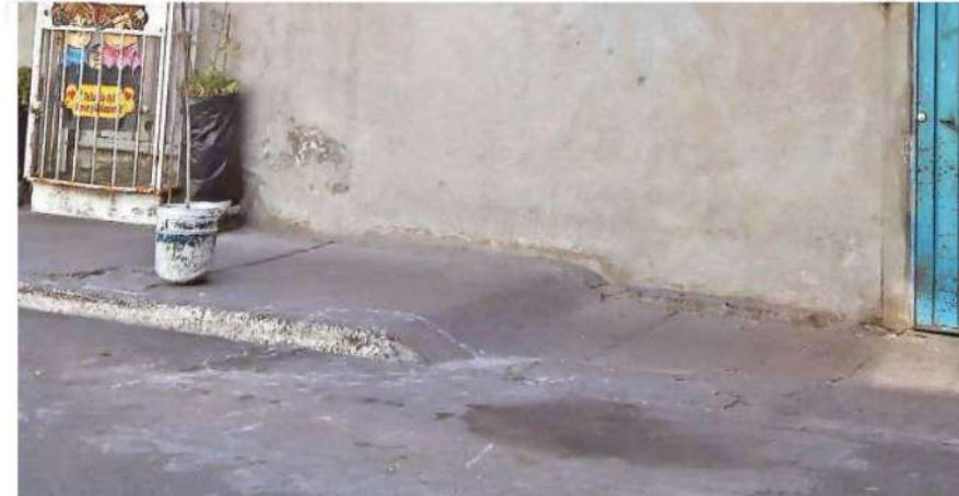
Habitantes salieron de sus hogares observaron tirada sobre el pavimento a la joven cubierta de sangre por lo que dieron aviso a las autoridades