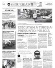
Los asesinos lo iban siguiendo