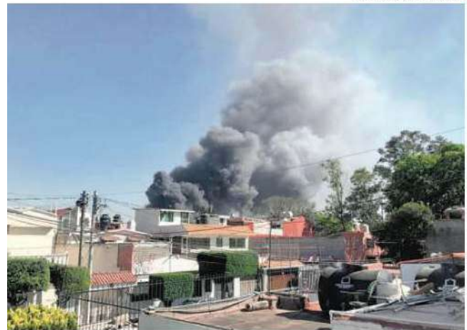
Ninguna persona resultó lesionada