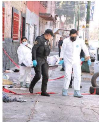
Una joven mujer en situación de calle murió durante la noche de ayer sin que se tenga clara el porqué

Una rosa roja fue lo único que quedó entre la basura y los objetos de la víctima mientras personal de la fiscalía realizaba las diligencias para luego hacer el levantamiento del cadáver y trasladarlo a la coordinación territorial correspondiente, donde se espera familiares acudan a reconocerla.