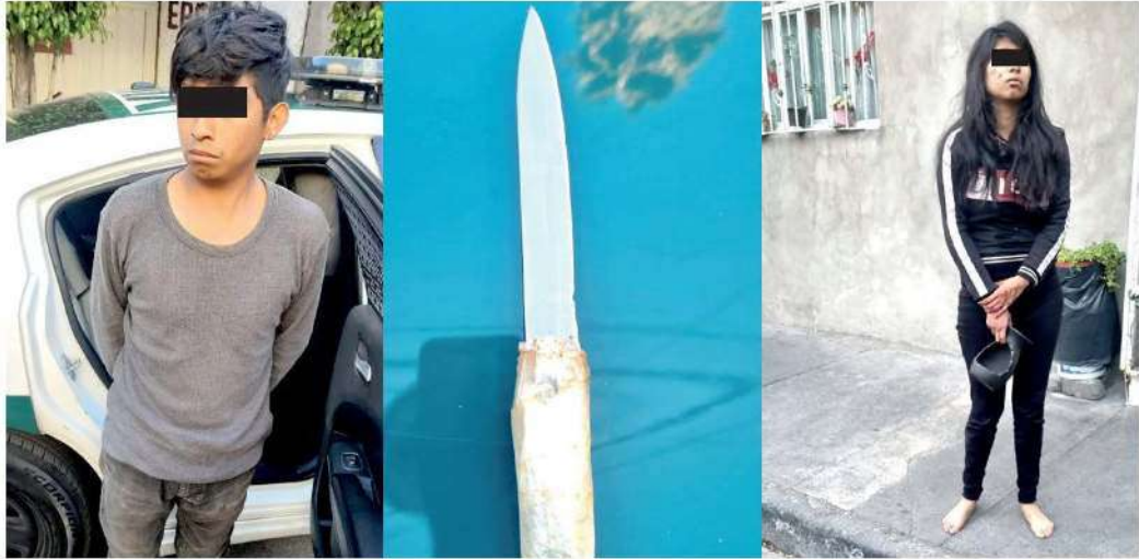
El desalmado sujeto atacó a su pareja cuando estaba dormida