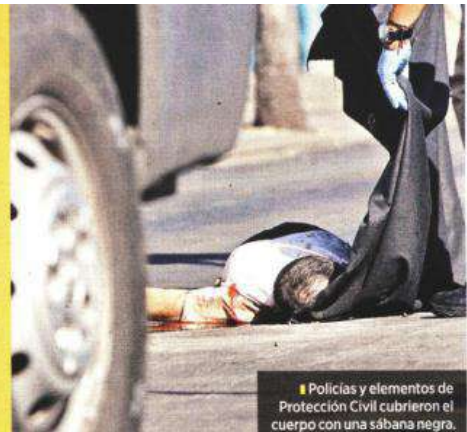
Policias y elementos de Protección Civil cubrieron el cuerpo con una sábana negra.

También, la camioneta fue asegurada y llevada hasta la agencia.