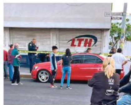
Arribaron al sitio elementos de la SSC para acordonar el lugar

Hasta el acordonamiento, poco a poco iban llegando familiares a reconocer los cuerpos. Entre ellas las viudas, mismas que tras llorar la pérdida, la de menor edad habló varias veces para dar a conocer la noticia a sus contactos.