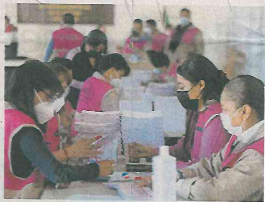
En el Edomex se instalarán 7 mil 718 casillas; en la Ciudad de México, 4 mil 810.

En el C5 se ubicará un equipo del Gobierno capitalino y una representación del Instituto Nacional Electoral, con el objetivo de revisar el desarrollo del proceso; una vez concluida la jornada, los elementos de la Secre-