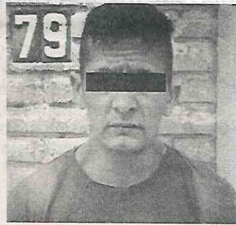
Duerme en el Oriente