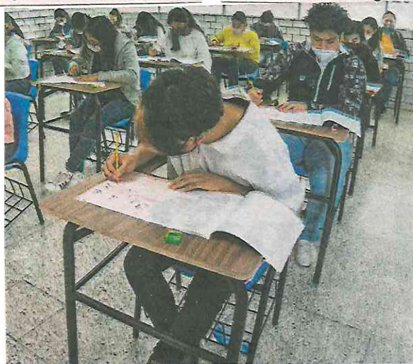
Aspirantes a estudiar una licenciatura, en el examen

Por otra parte, la Rectoría propuso al STUNAM regresar a las actividades administrativas de forma presencial a partir del 24 de mayo, luego de que la Secretaría de Salud declarara a la Ciudad de México en amarillo epidemiológico.