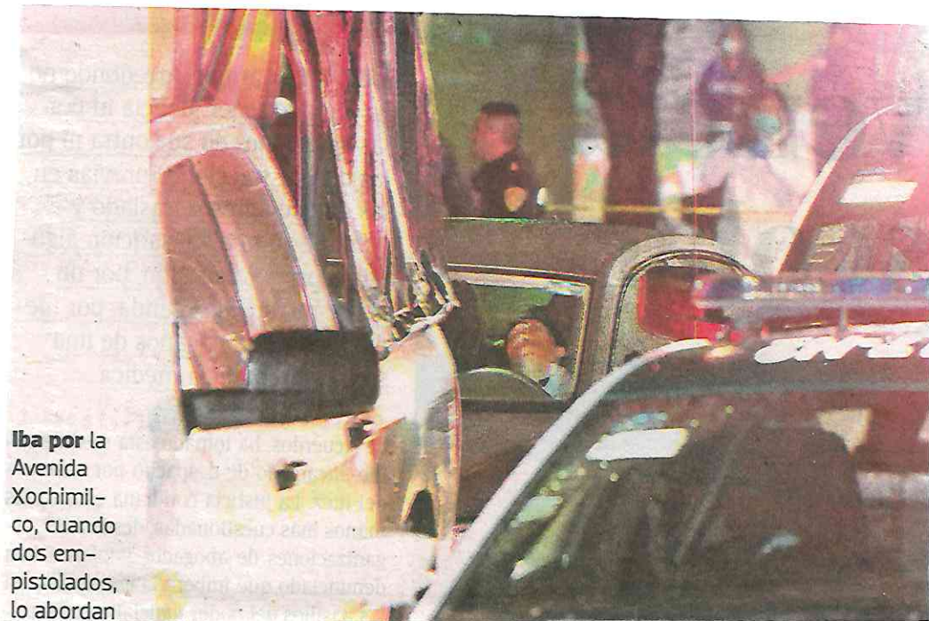
Iba por la Avenida Xochimil- co, cuando dos em- pistolados, lo abordan

Aproximadamente, a las 22:00 horas, peritos de la Fiscalía General de Justicia de la Ciudad de México, llegaron al lugar para recabar los indicios de prueba y realizar el levantamiento del cadáver.