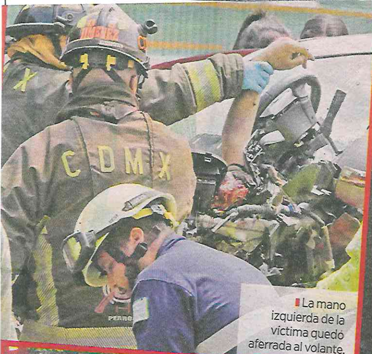
La mano izquierda de la víctima quedó aferrada al volante.