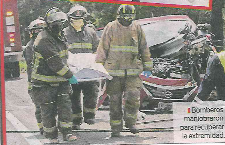
Bomberos maniobraron para recuperar la extremidad.