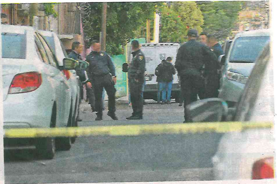
Así quedó en calles de la colonia Del Carmen, otra víctima

Los hechos ocurrieron alrededor de las 18:00 horas de este viernes. Testigos afirman haberse escondido tras escuchar las detonaciones, sin poder apre-