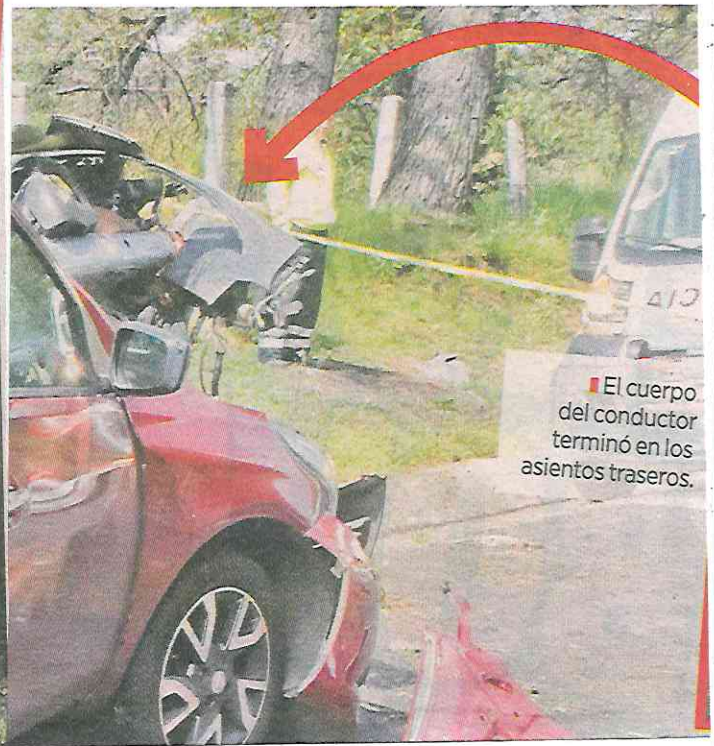
El cuerpo del conductor terminó en los asientos traseros.